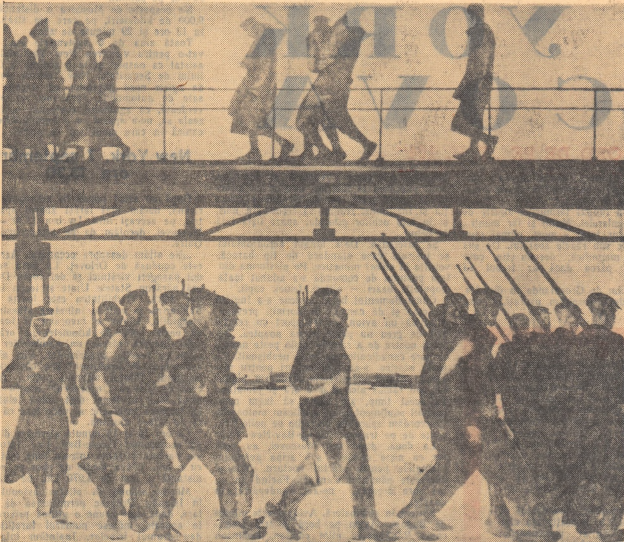
Apărarea Petrogradului, pictură de A. A. Deinek

glonte în piept cu scopul de a-și ridica viața”.