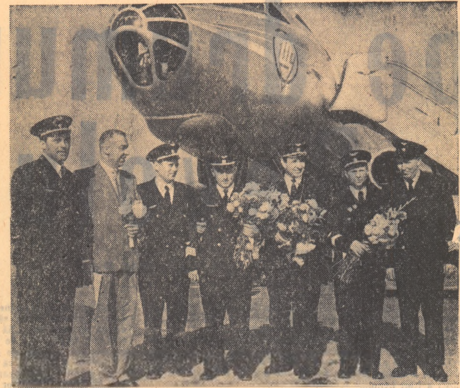
Echipajul lui „Tu-104 A” la capătul călătoriei sale victorioase

dienii au reușit să stabilească legătura cu Goose-Bay, pe unde ultrascurte. Societile noastre s-au scutit a fi bune: timpul e favorabil. Goose-Bay ne primește.