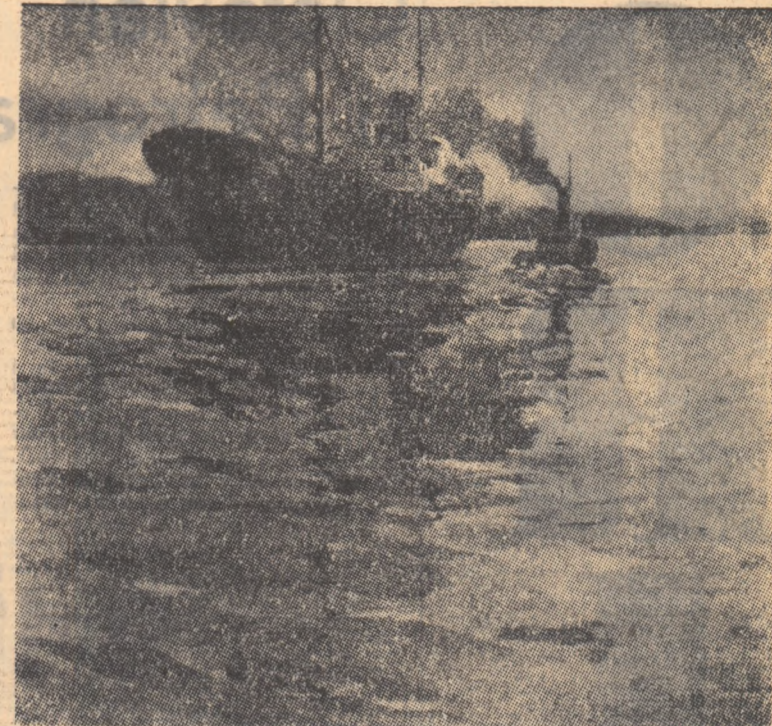
D. Cerkes In tadă

„Întreaga creație a experienței Revoluției din Octombrie ușurează drumul spre socialism pentru toate țările care s-au eliberat de sub jugul capitalismului. După cum arată tezele secției de agitație și propagandă a C.C. al P.C.U.S. și ale Institutului de marxism-leninism de la Moscova, experiența marelui Octombrie și a celor 40 de ani care s-au scurs din momentul triumfului revoluției socialiste în U.R.S.S. dovedește existența unor trăsături comune, a unor legi generale ale construcției societății noi. Întregul efect al înlăpturii acestor legi generale poate fi obținut numai în lupta perseverentă împotriva reformismului și oportunistului, împotriva dogmatismului și a sectarismului.