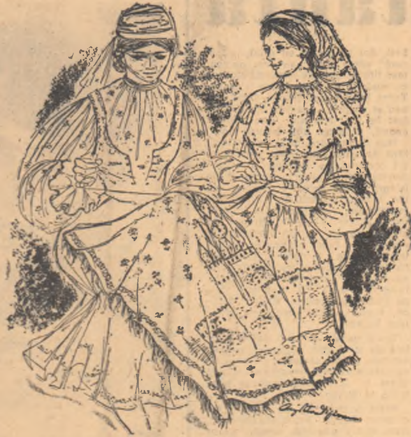
desen de Angh Petrescu — Tipărescu