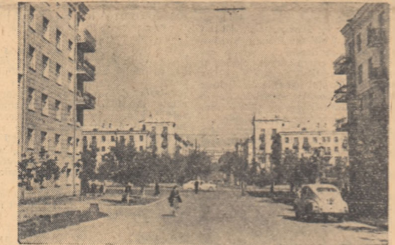
Magnitogorsk: Str. V. Kuibșev