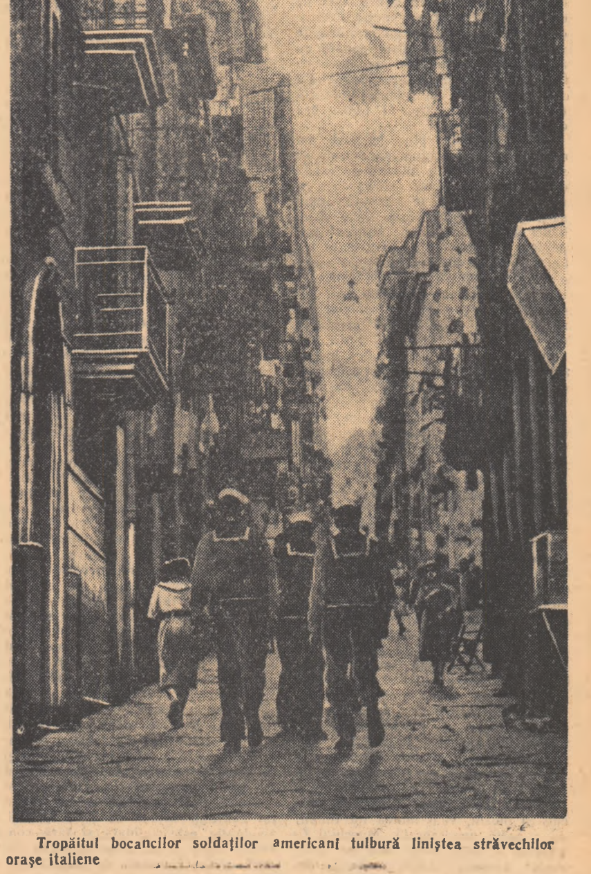
Tropăitul bocancilor soldaților americani tîbură liniștea străvechilor orașe italiene

„Forțele păcii sînt uriașe — spune „Manifestul Păcii”. Ele pot să împiedice războiul, să mențină pacea. Dar noi, comunistii, considerăm de datoria noastră să avertizăm pe toți oamenii din lume că pericolul unui monstruos război de exterminare a oamenilor n-a trecut încă”. Acest avertisment — la veghe este cu deosebire util. El va face ca unitatea lagărului socialist, unitatea forțelor militante pentru pace, să opună un zid de netrecut imperialismului, care caută în afara frontierelor lui soluția contradicțiilor lui interne.