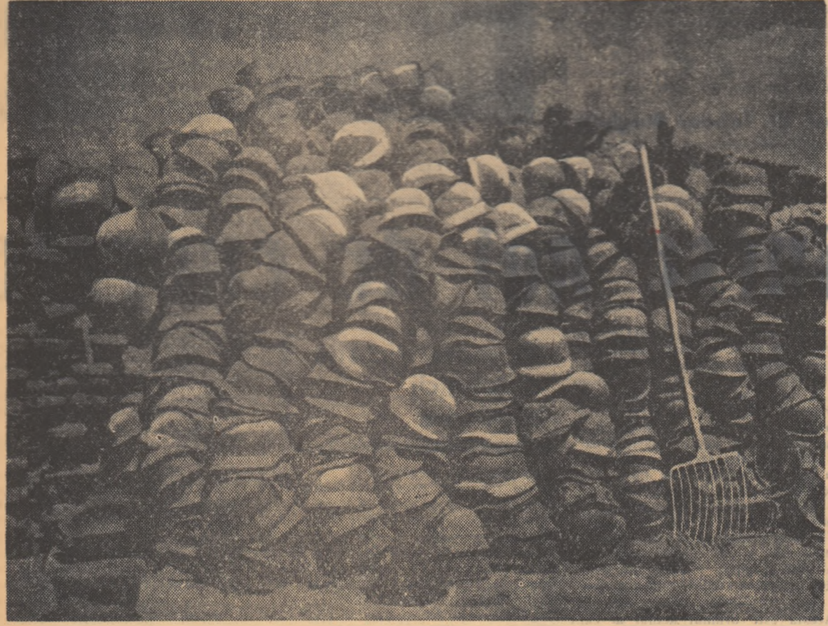
Această fotografie datează de la sfârșitul celui de-al doilea război mondial și înfățișează sfârșitul lipsei de glorie al diviziilor hitleriste. ...O imagine care ar trebui să dea de gândit noilor amatori de aventuri războinice.

formulă guvernamentală care va face mari comenzi de stat. Comenzile de război au favorizat însă mai mult alți grupuri Wall-Street-ului, cit și grupul Giannini. De unde resentimentele celor de a cuceri piața internă, cum au fost în ultimii ani luptele pentru controlul căilor ferate și al presei de mare tiraj. Rivalitatea dintre diversele grupe financiare a dus și la rivalități politice și, indirect, la concepții opuse în politica externă. În timp ce grupul din Wall-Street este pentru o politică militaristă a outrance, grupul vestului mijlociu s-a pronunțat adeseori pentru găsirea unui modus vivendi cu lagărul socialist. Primul grup este pentru așa zisa „strategie totală”, care urmărește atragerea întregii lumi capitaliste în sistemul militar și politic al Washingtonului, pe bază de blocuri dirijate împotriva U.R.S.S. și a democrațiilor populare. Cel de al doilea socotea că blocurile militare și politice sporesc prea mult obligațiile Statelor Unite și le „leagă mâinile”. De fapt, în această atitudine, vorbește teama de a nu rămâne pe plan financiar secundar.