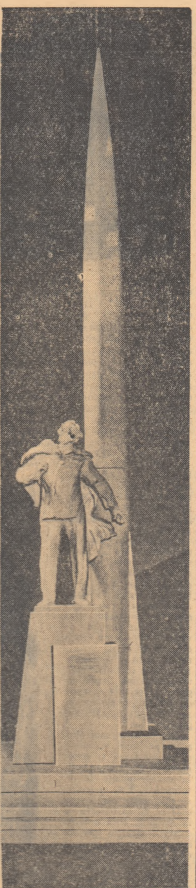
Machetă pentru o statuie a lui K. E. Tjolkovski