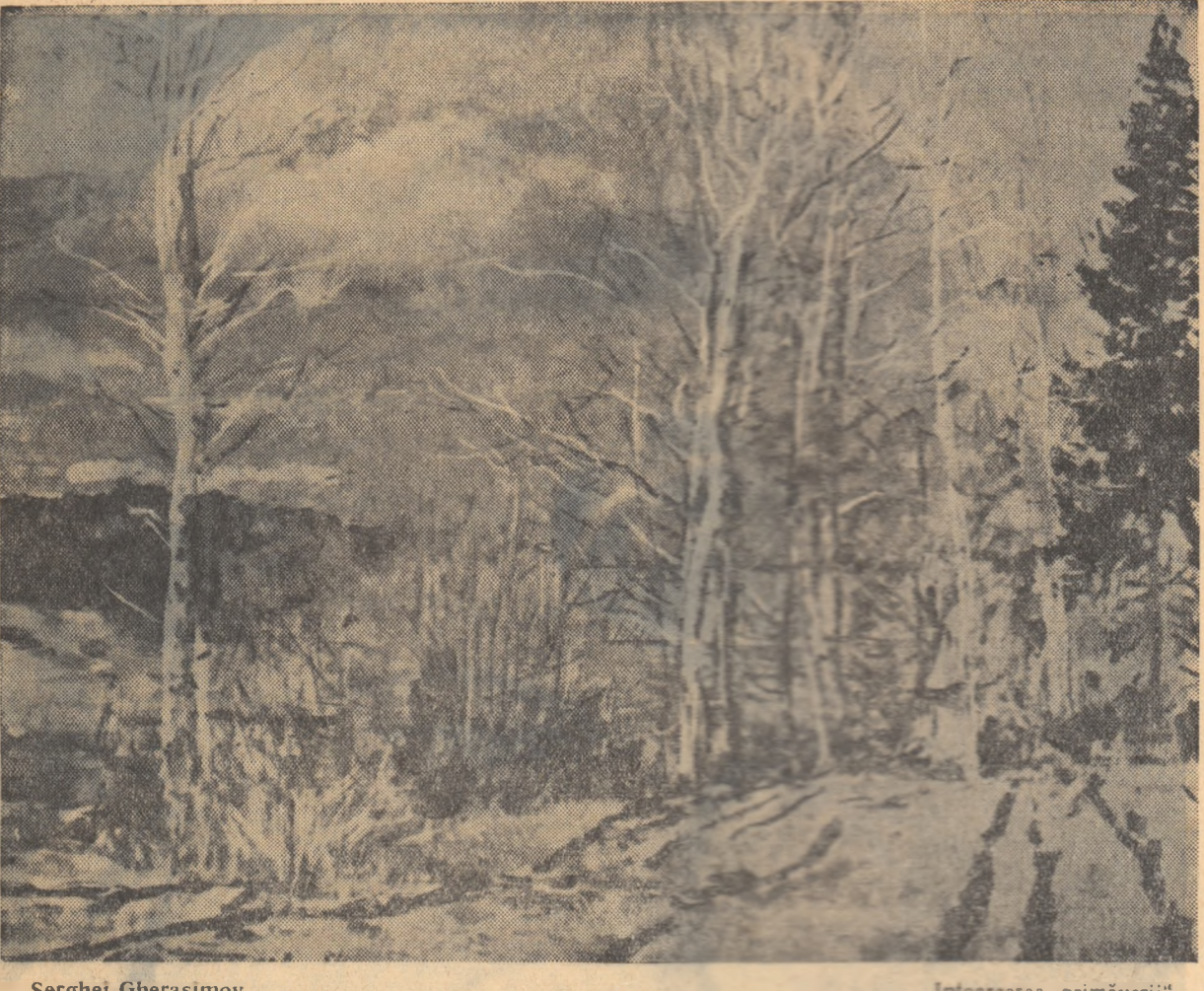
Sergei Gherasimov „Întoarcerea primăverii”