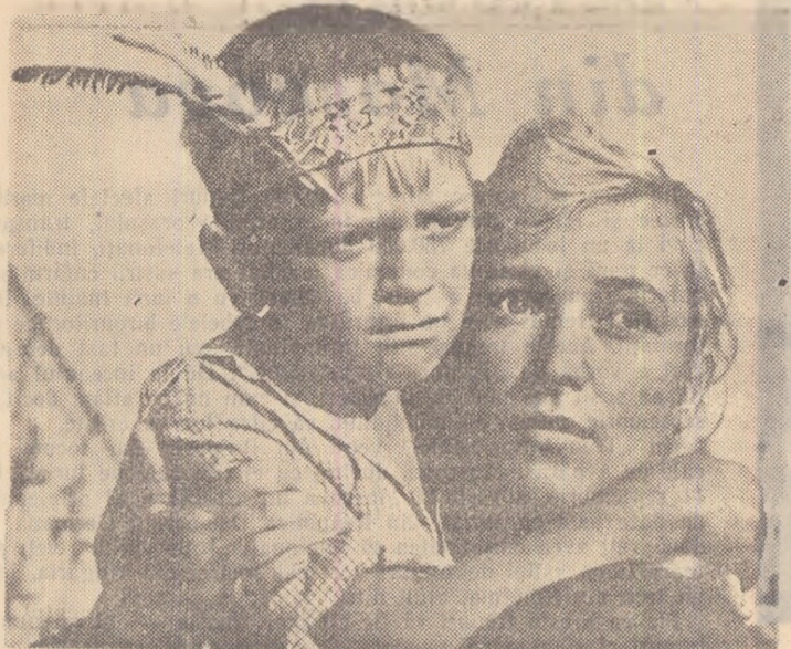
Scenă din filmul „Viața e în mâinile tale”.