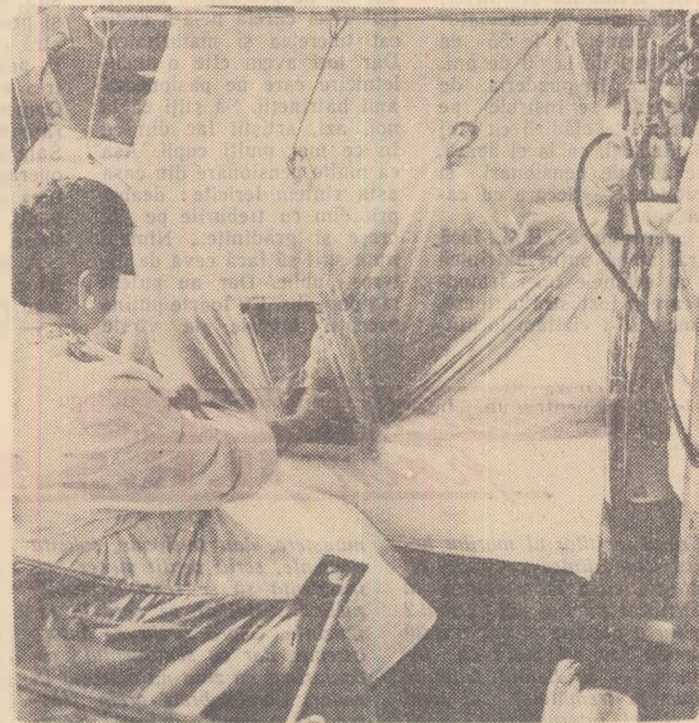
Sănătatea minerilor se află sub permanenta supraveghere a medicilor sovietici.