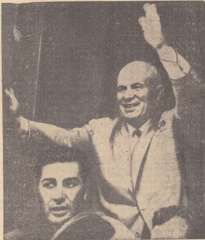
N. S. Hrușciov răspunde ovațiilor mulțimii adunate pe peronul gării din San Luis Obispo.

Ziarele din lumea întreagă au ilustrat cu lux de amănunte și întâlnirea pe care N. S. Hrușciov a avut-o la 20 septembrie cu actorii americani. Timp de mai multe săptămâni la Hollywood s-a desfășurat o adevărată cursă pentru obținerea de invitații la acest eveniment, ne care ziarista americană Mar-