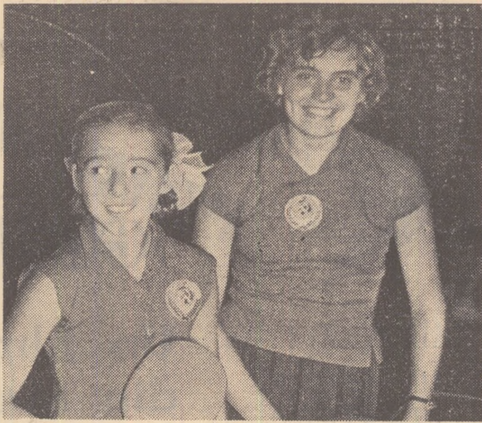
La Moscova a luat sfârșit turneul internațional de tenis de masă cu participarea echipelor Ungariei, României și U.R.S.S. Locul întâi pe echipe a fost cucerit de jucătoarele sovietice. In clișeu: două dintre jucătoare.