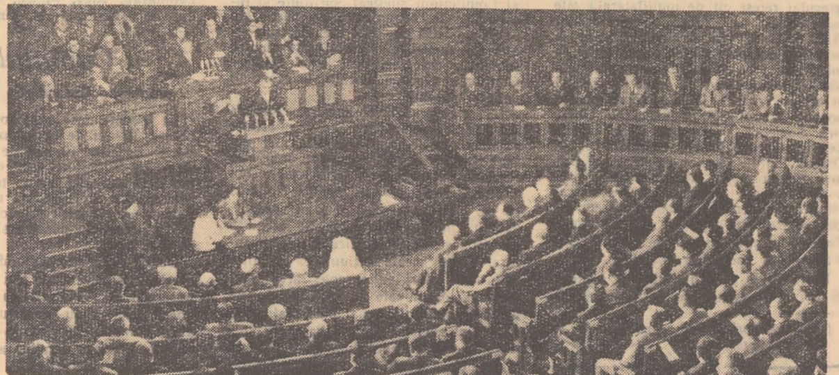
Un aspect din sala Congresului

Conștienți de măreția cauzei noastre nobile, vom munci cu dragoste și entuziasm sub conducerea Partidului Muncitoresc Român, pentru înflorirea patriei noastre scumpe, Republica Populară Română, pentru victoria socialismului, pentru apărarea păcii, pentru întărirea continuă a prieteniei romino-sovietice.