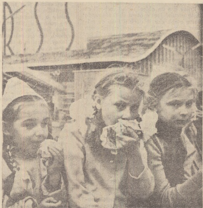
Delicioasa „morojenia”, se stîlca înghețată moscovită, este savurată cu plăcere nu numai de mici vizitatori...

Pe un ingenios postament de oglinzi care sugerează cu jocul lor de ape argintii infinitul spațiu sideral, au fost instalate machetele celor trei sputnici, a ultimei trepte a rachetei cosmice și a fanionului sovietic care a ajuns pe Lună. Partea aceasta a expoziției reunește în jurul ei publicul cel mai eterogen. Dacă în general standurile operează în rîndul vizitatorilor o selecție pe criteriile profesionale, aici, lîngă imaginea erei cosmice, se opresc cu egal interes elevi și pensionari, ingineri și medici. Iar discuțiile dovedesc cît de profund au intrat în viața de toate zilele termenii abstracți și dificili ai științei cosmosului, cîtă admirație au stîrnit succesele U-