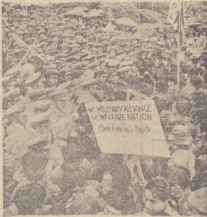
Poporul japonez spulberă „U-2” imperialismului american

Compromiterea iremediabilă a guvernului S.U.A. datorită torpilării de către acesta