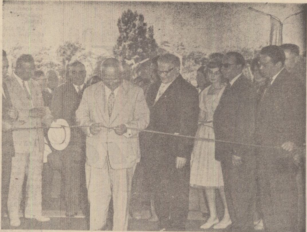
Duminică 19 iunie, expoziția și-a deschis porțile. Un moment solemn: tovarășul N. S. Hrușciov taie panglica, invitînd oaspeții în pavilionul expoziției.

Conform prevederilor planului septenal, pe care ziarștii l-au numit „a doua rachetă cu multe trepte”, mecanizarea și automatizarea se extînd în cele mai diferite ra-