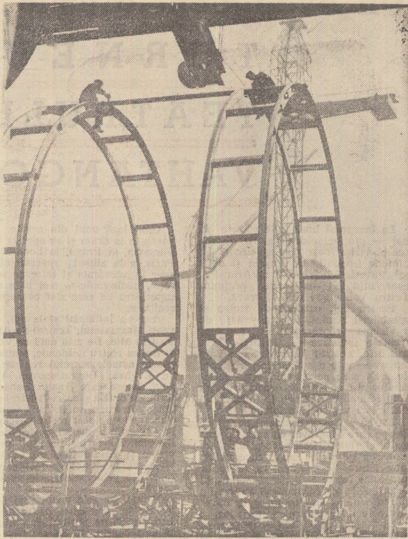
Se construiește un nou furnă