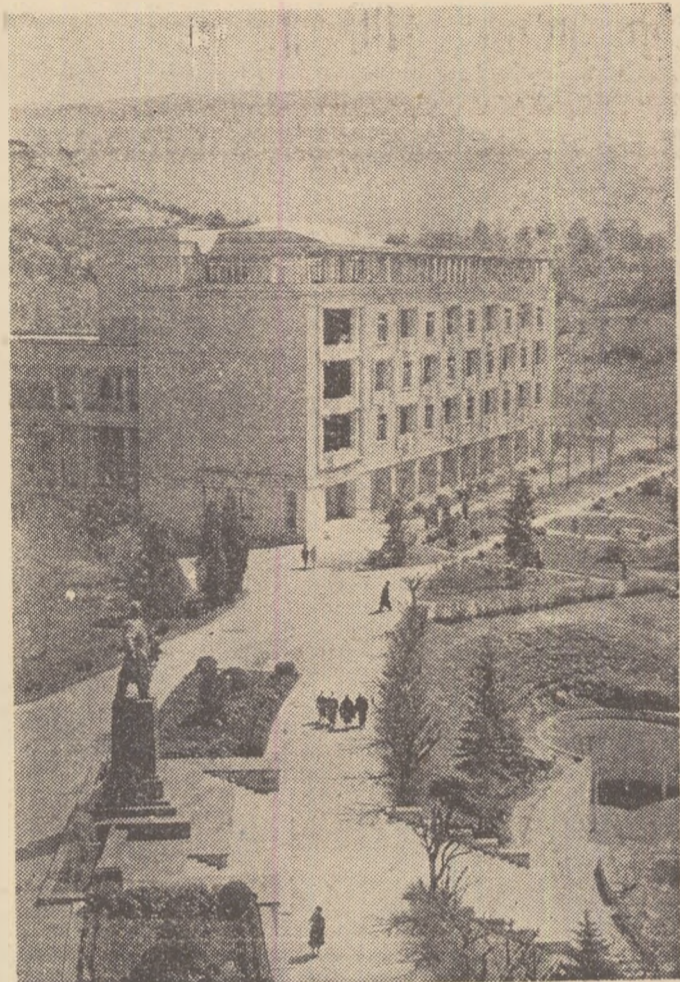
Kislovodsk. Sanatoriul „Sergo Ordjonikidze“