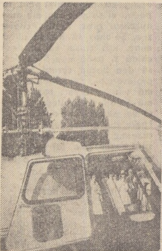
Una din atracțiile expoziției o constituie „taxiurile aeriene”, elicopterele. Ele efectuează zboruri de agrement deasupra Bucureștiului.

Expoziția solicită atenția multilaterală a vizitatorilor. Aceștia zăbovesc îndelung lîngă fiecare exponat, îl studiază pe îndelete, cer lămuriri ghidului. Preferințele vizitatorilor sînt în general determinate de criteriile profesionale. Lucru firesc: expoziția sovietică este o imagine concentrată a unei experiențe bogate și deosebit de valoro-