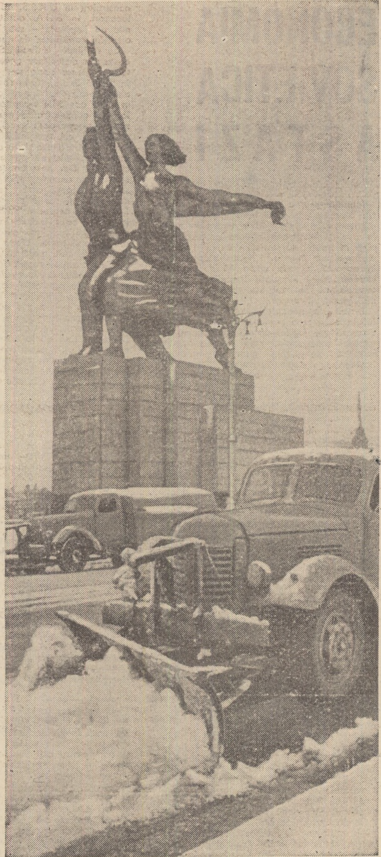
La Moscova a căzut prima zăpadă

— Spuneți și dumneavoastră... Despre micile fapte semnificative observate într-o scurtă, mult prea scurtă călătorie, ar fi mult de scris, dar spațiul, eterna scuză a scriitorilor, mă face să vă rog să mă urmăriți și cu alt prilej.