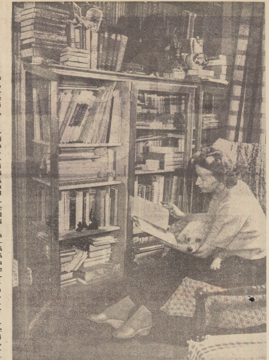
Galina Ulanova în intimitate

La Muzeul L. N. Tolstol din Moscova s-a deschis recent o nouă expoziție. Un deosebit interes suscită standul intitulat „Tolstol și vremea lui”, care-și înfățișează pe marelui scriitor rus ca publicist, demascator inflăcărat al nedreptăților sociale. Prin-