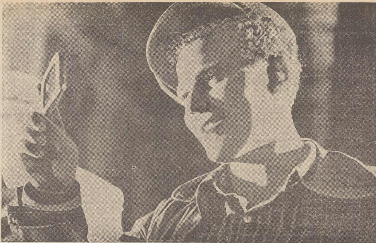
Inginer de la Hunedoara