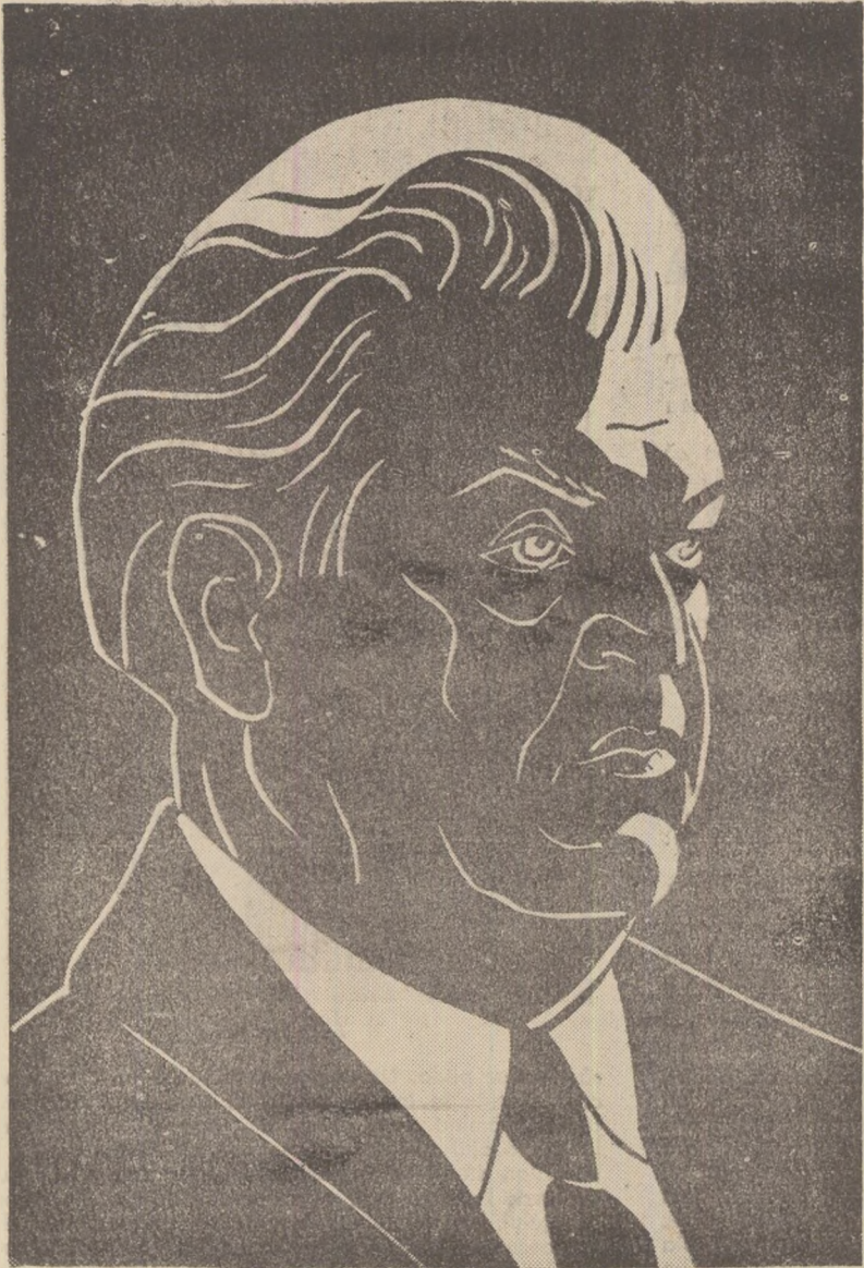
Gravură de Hariton