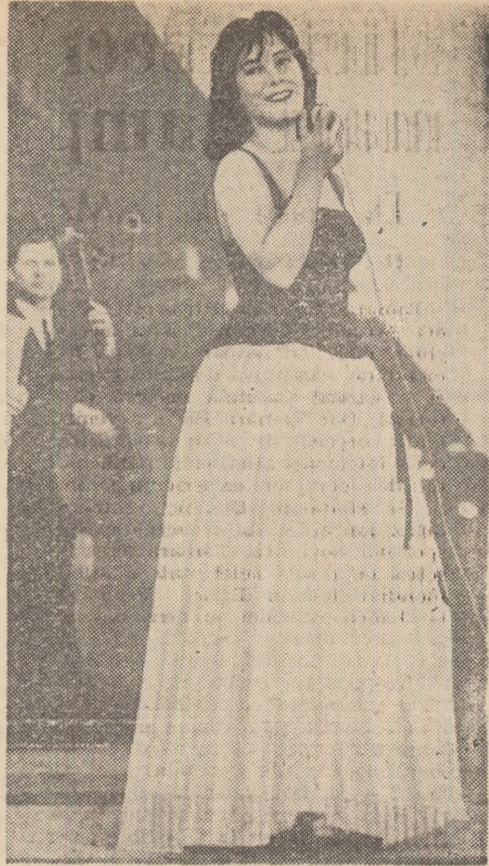
Tatiana Samoilova în filmul „Leon Garros își caută prietenul”