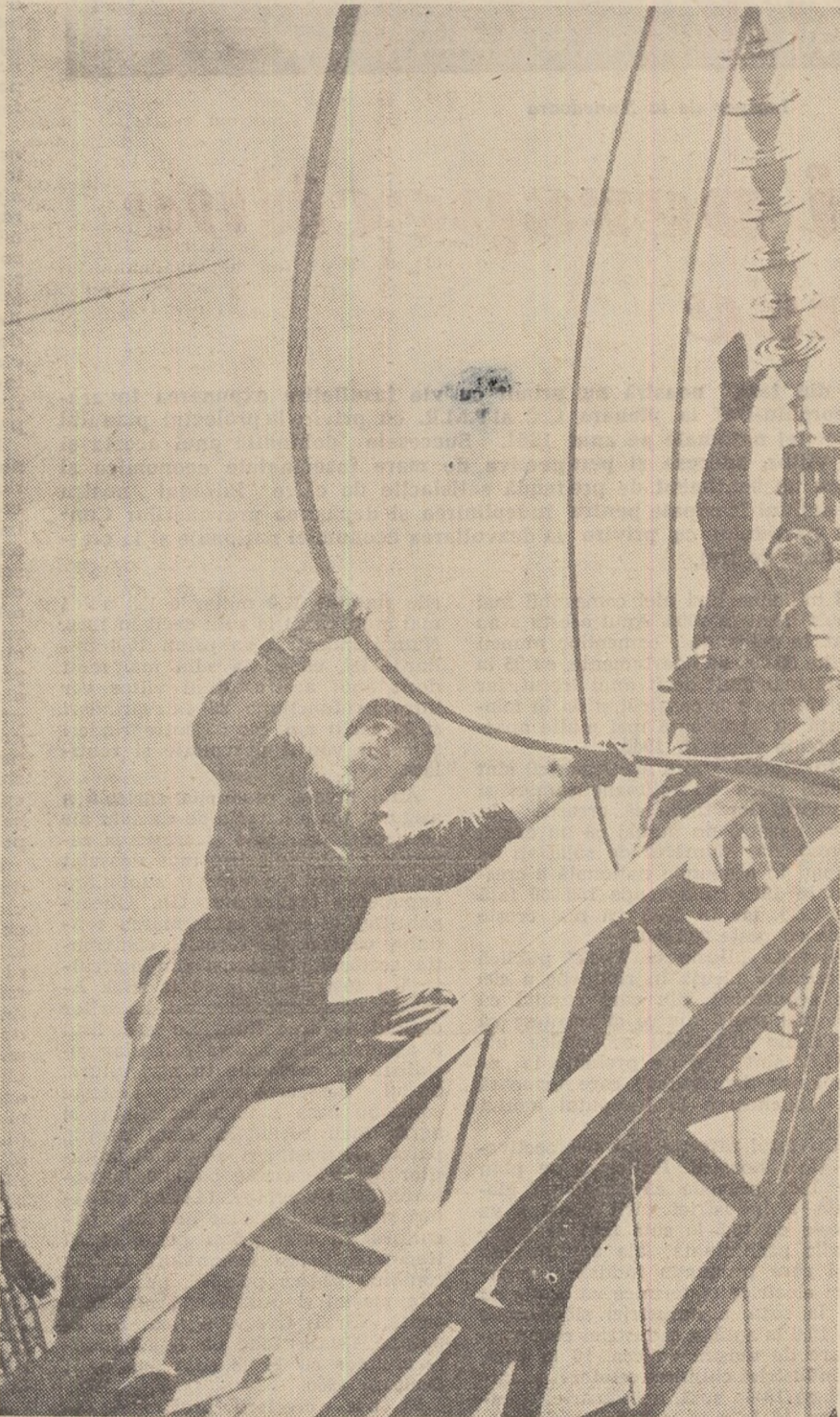
Pe șantierele septenalului

Am fost obișnuiți să denumim case de locuit suma unor apartamente grupate în jurul unei scări. Și chiar dacă, uneori, primul etaj al blocului era destinat, să zicem, unui magazin, aceasta nu schimba mai nimic din vechea stare de lucruri. Între locatarii casei și magazinul respectiv nu exista nici o legătură organică. Acum, însă, întreaga rețea de instituții sociale, culturale, comerciale ale microraiionului va fi indisolubil legată de viața locuitorilor săi. Totul a fost stabilit, cu amănunțime. Spațiul creșelor și căminelor a fost calculat pentru 140 de copii la mia de locuitori. Rețeaua restaurantelor — pentru 90 la sută din populația raionului. Microraiionul va