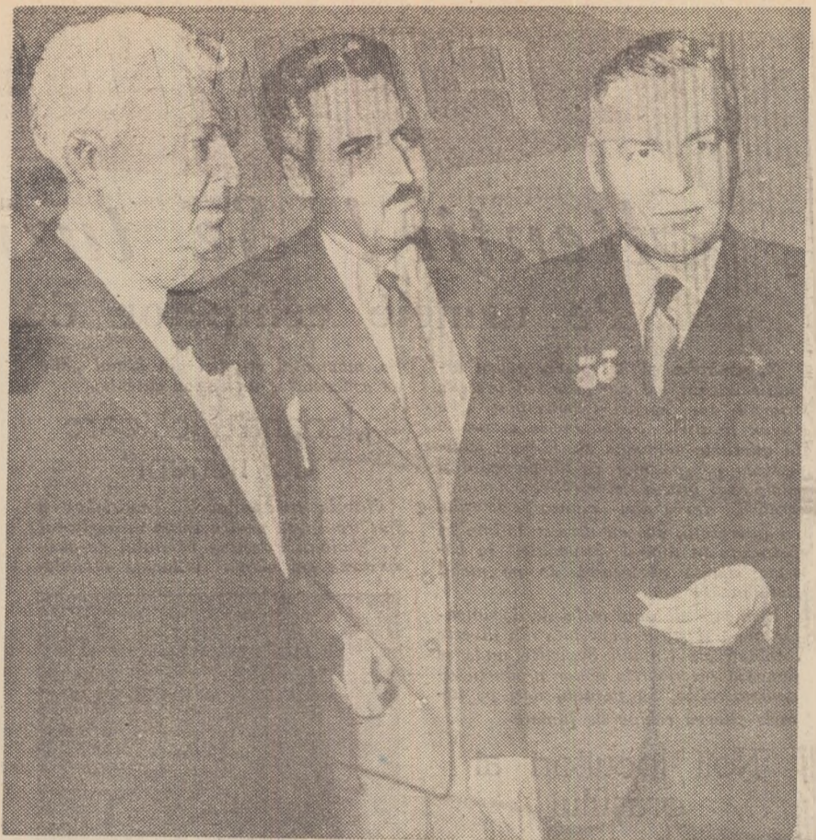
Mihail Sadoveanu, K. Simonov și Vilis Lațis la Moscova, în 1955