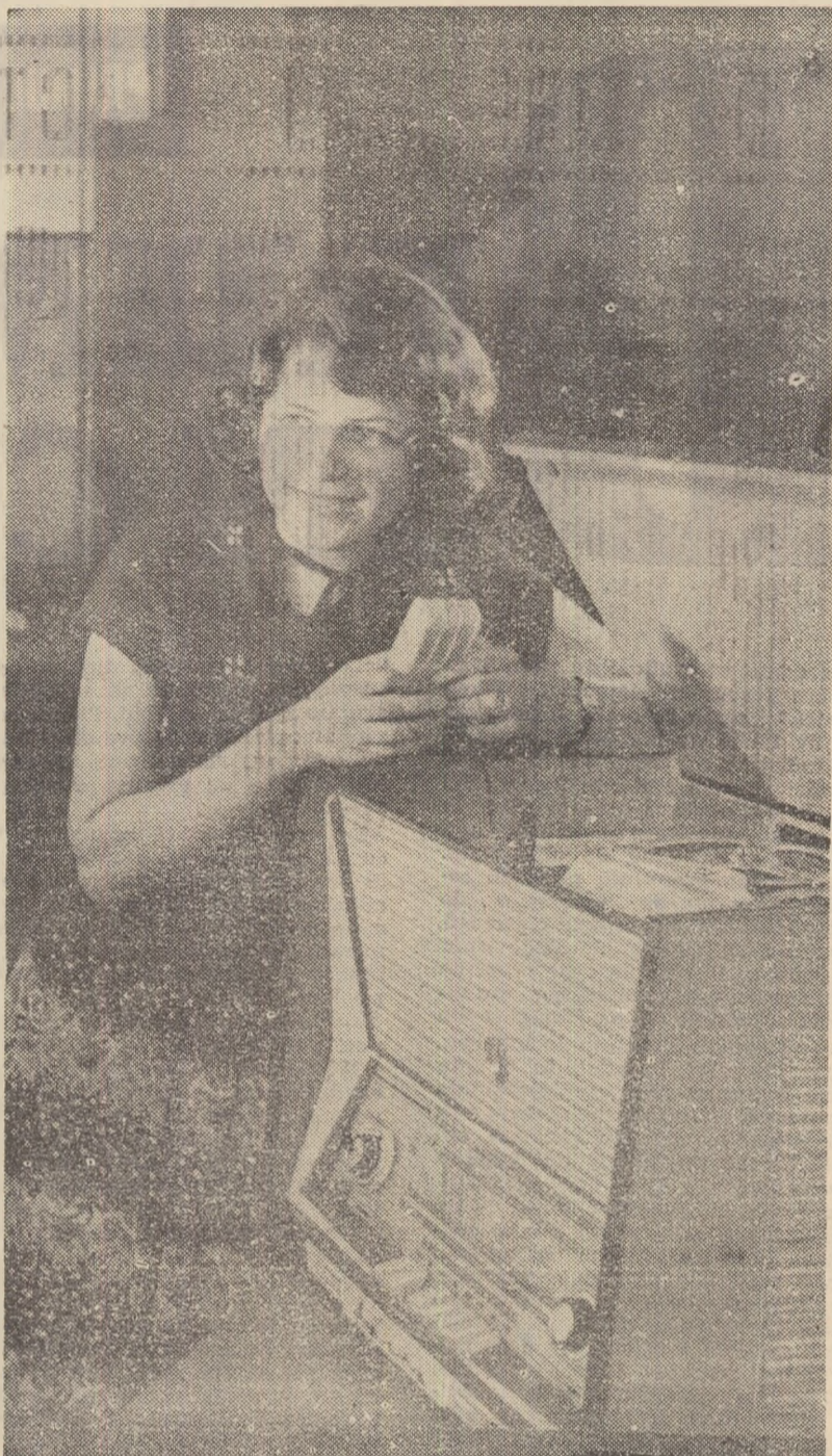
Noul aparat de radio-magnetofon „Vaiva”, fabricat la Vilnius.

Încheind această sumară prezentare în să exprim în numele delegației noastre care a participat la Congres cele mai sincere felicitări biochimistilor sovietici pentru excelența și impecabila organizare a celui de al 5-lea Congres internațional de biochimie de la Moscova, care a adus o extrem de prețioasă contribuție nu numai la dezvoltarea biochimiei, dar și la cauza colaborării pașnice a oamenilor de știință din întreaga lume.