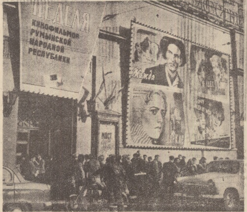
Cu prilejul celei de a XVII-a aniversări a eliberării patriei noastre de sub jugul fascist, la cinematograful „Hudojestvennii” din Moscova a fost organizată o săptămîna a filmului românesc.