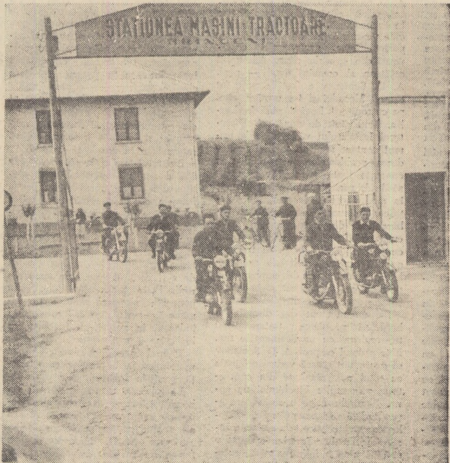
Noul peisaj rural al regiunii

membrou al Biroului Consiliului raional A.R.L.U.S.-Călărași