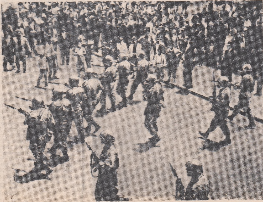
Un aspect obișnuit în țările Americii Latine: armata reprimă manifestațiile