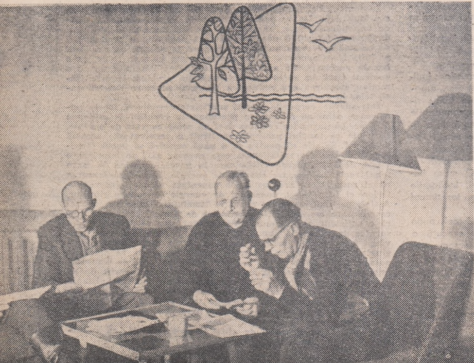
casa de odihnă intercolhoznică de la Narva-Iessu (R.S.S. Estonă)