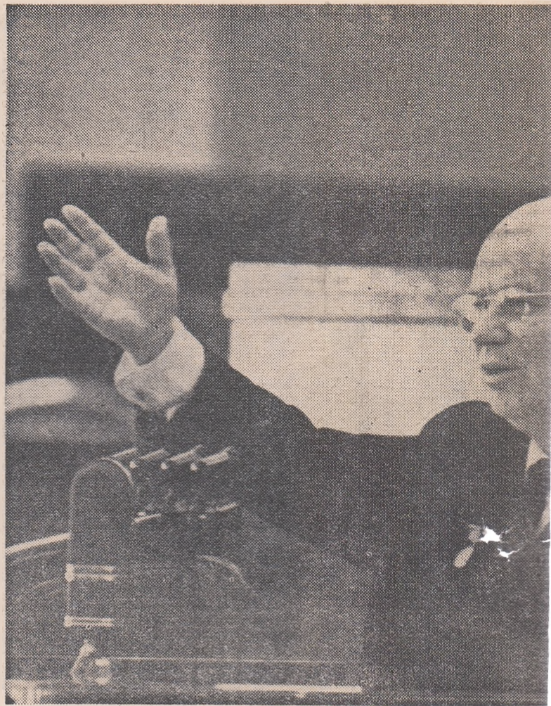
N. S. Hrușciiov rostind cuvântarea de închidere la Plenara C.C.

Încă din anul acesta, 22 milioane hectare pot fi eliberate de sub ierburi și ogoare negre, redându-le unor culturi mai valoroase ca porumb, sfeclă de zahăr, mazăre, leguminoase furajere.