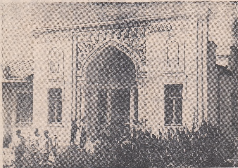
Casă de cultură într-un sat kirghiz