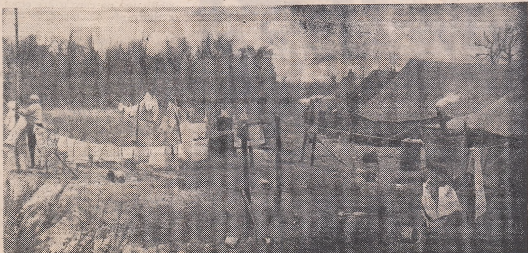
Iată cum arată „satul libertății”