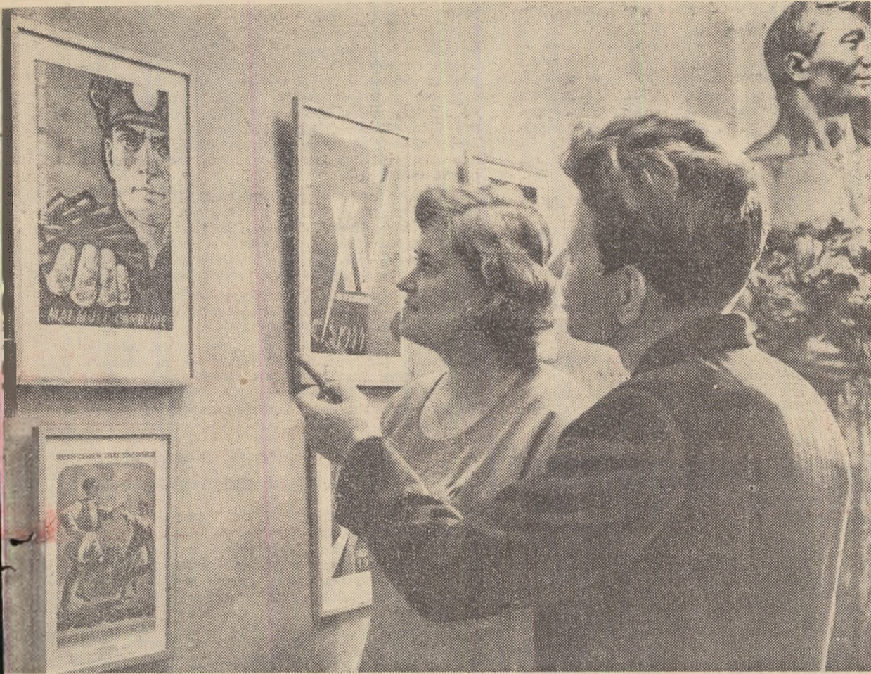
La Galeria kazahă de stat din Alma-Ata a fost deschisă o expoziție de reproduceri de grafică românească