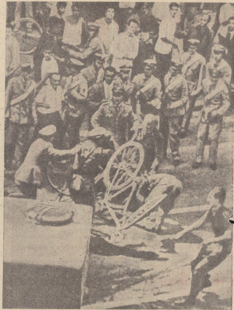
La Bari: poliția și armata atacă pe greviști

La Roma sînt foarte multe fîntîni frumoase. Dar cea mai cunoscută este fontana Trevi. După o veche credință, cine vrea să se întoarcă la Roma trebuie ca, înainte de a părăsi „orașul veșnic”, să arunce o monedă în fîntîna Trevi. Oamenii se apropie de fîntînă și aruncă peste umărul drept tot felul de monezi, spre marea bucurie a băiețandrilor oacheși. Și sînt foarte întreprinzători acești băieți! Seara tîrziu, cînd paznicul pleacă la un bar din apropiere să bea o ceașcă de cafea neagră, copiii se aruncă în fîntînă și o curăță, pe cît e posibil, de prejudecățile omenești.