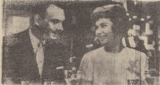
Film distins cu marele premiu „Globul de cristal” la Festivalul Internațional al Filmului de la Karlovy-Vary, 1962.