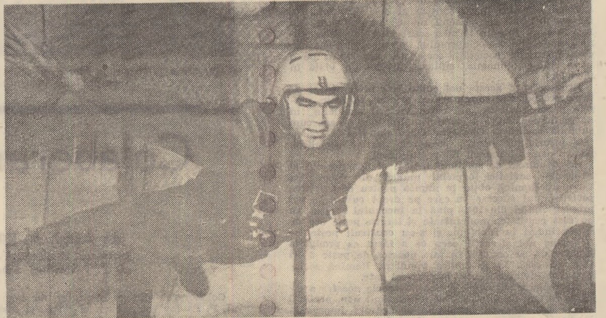
In stare de imponderabilitate...

logice și vestibulare obișnuite am completat teste psihologice; am efectuat rapid calcule matematice simple; am reconstituit figuri geometrice situate haotic pe niște tăblițe speciale; am desenat spirale și stele; am scris ba cu mina dreaptă, ba cu stînga, ba cu ochii deschiși, ba cu ei închiși. După aceste teste se puteau determina gradul de intensitate al atenției noastre, gradul de oboseală, fermitatea calităților voliționale. Era un exercițiu interesant, care cere anumite eforturi, concentrare