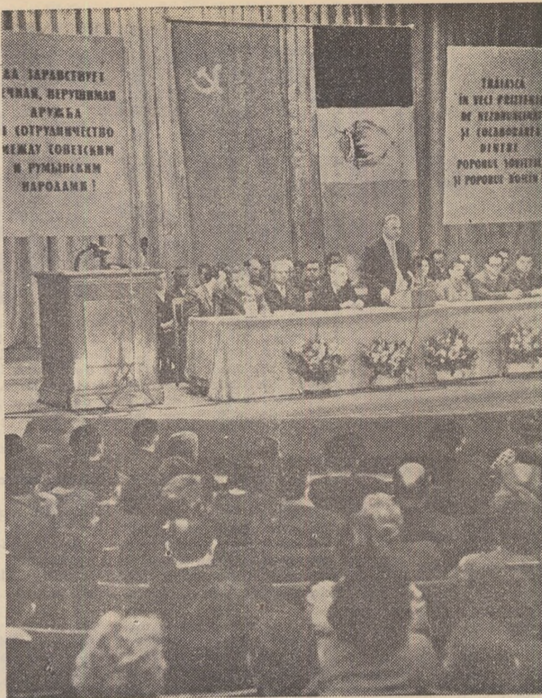
Sărbătoare a prieteniei la Moscova. Festivitate organizată de Asociația de prietenie sovieto-romină

La acțiunile ce se vor desfășura în această lună sărbătorească vor participa orașele și satele țărilor, toți constructorii socialismului, întregul popor român. Se va dovedi astfel încă o dată că oamenii sovietici au în România 18.000.000 de prieteni!