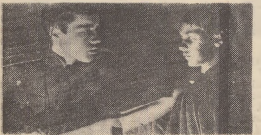
Film distins cu premiul „Leul de aur” la Festivalul Internațional al Filmului de la Veneția, 1962.