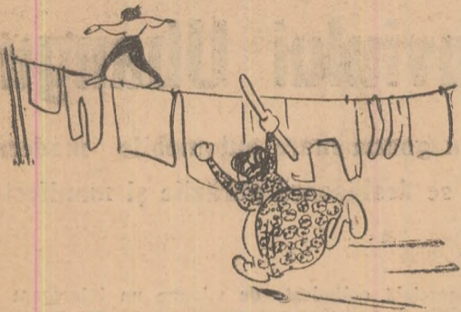
Primii pași spre glorie.