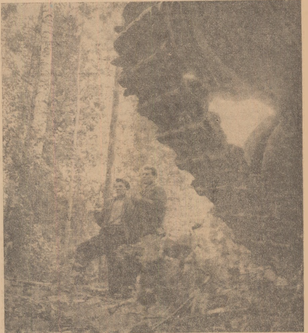
În taiga, pe „urmele” petrolului

Oamenii de știință sovietici au prevăzut, cu mulți ani în urmă, existența petrolului în regiunea Tiumen (Siberia apuseană). Ipoteza era îndrăzneață și se cerea verificată. Zeci de expediții au luat drumul taigalei. Străbătînd desișuri prin care nu călcăse picior de om, geologii au cercetat subsolul cu cele mai noi metode — seismice, aeromagnetice, electrice. Mașinile croiau drum sondorilor care înaintau lăsînd în urmă-le pături de sonde. În momentul de față în regiunea de dincolo de Ural sînt cunoscute 8 zăcăminte de petrol.