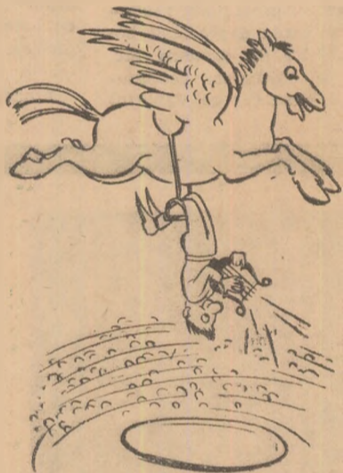
Poetul s-a regăsit.