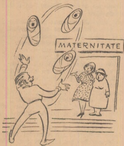
— Nu va speriați, o face de bucurie. E jongler.