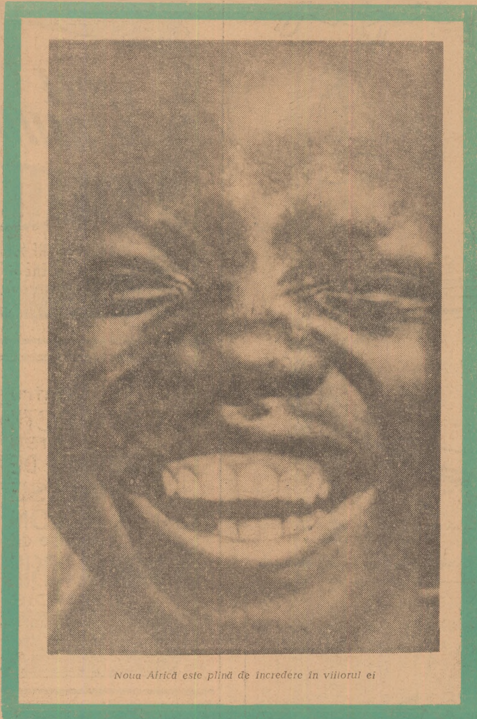
Noua Africă este plină de încredere în viitorul ei

profiturilor obținute de companiile comerciale europene, care funcționează în țară, să fie limitat.