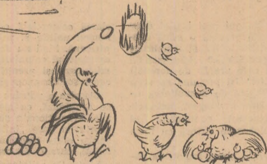
— Înainte de a se însura, soțul meu a fost artist de circ...