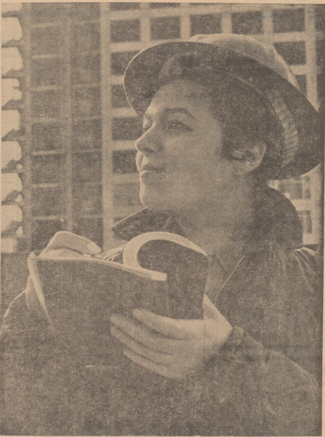
Pe un șantier din centrul Moscovei. Inginerul constructor a găsit soluția cea mai potrivită...