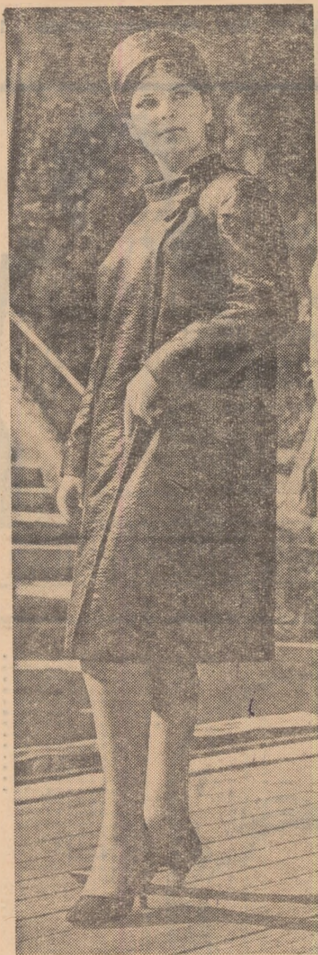
Ansamblu elegant creat de Casa de modă din Baku