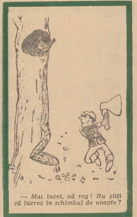
— Mai încet, vă rog! Nu știți că lucrez în schimbul de nopțe?