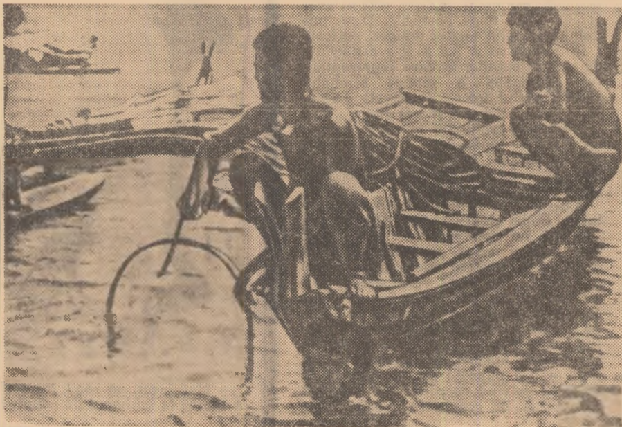
Insularii întîmpină dimineața în bărci