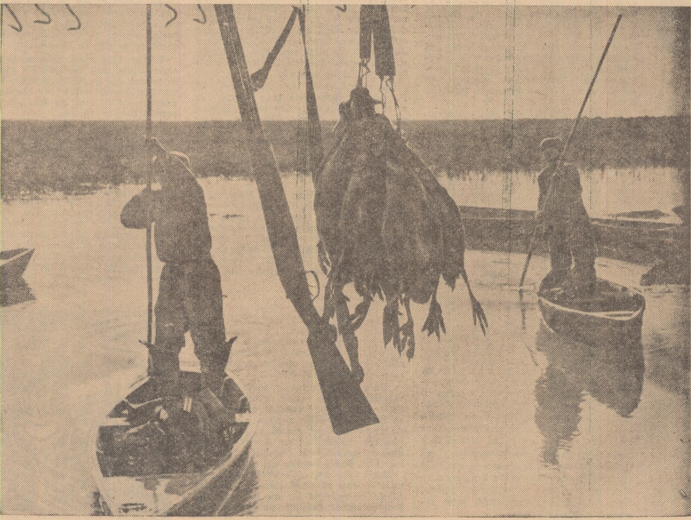
Trofeele vânătoarești ale toamnei