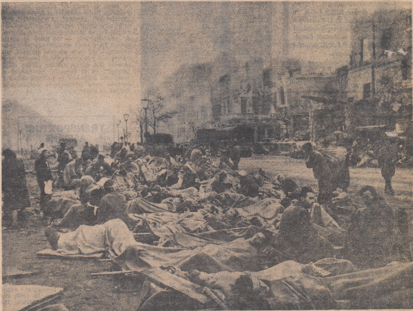
Berlin, în primele zile ale lui mai 1945..

În cazul nostru era lîmpede că bătrînul colonel nu putea hotărî singur. Locotenent-colonelul urcă în balcon. Se reîntoarse curînd și șopti ceva comandantului.