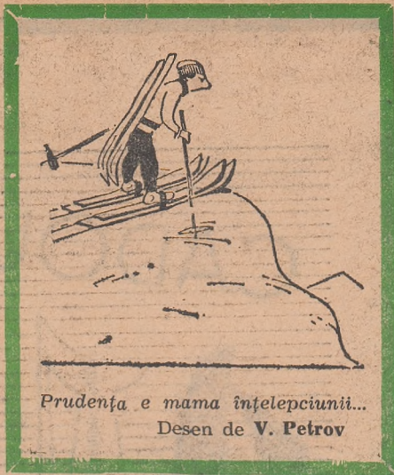
Prudența e mama înțelepciunii... Desen de V. Petrov

În concluzie, putem spune că diapazonul coloristic al costumului sportiv este iarna aceasta foarte amplu. Un adevărat curcubeu pe zăpadă.