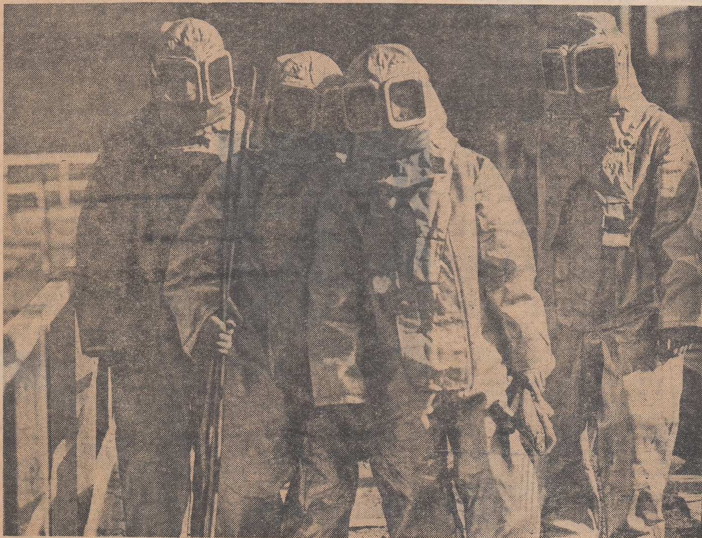
Scafandri, cosmonauți? Nu! Sînt modernii „chirurgi” sovietici ai cuptoarelor Martin, în care efectuează intervenții urgente la temperaturi de pînă la 180 de grade

Recifele de corali — fortăreață inaccessibilă