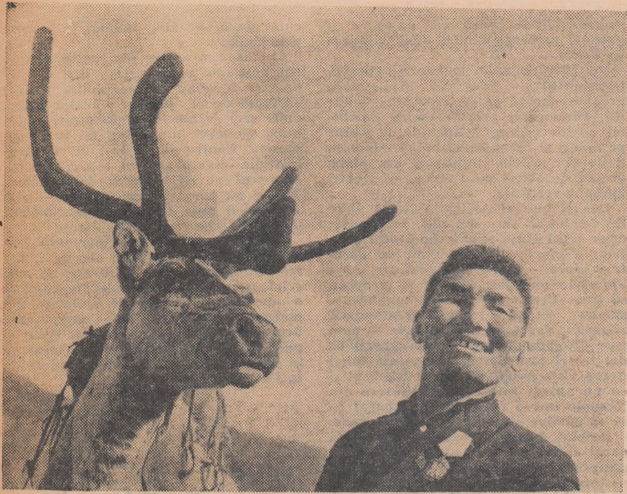
Au străbătut împreună mulți kilometri din tundra siberiană.