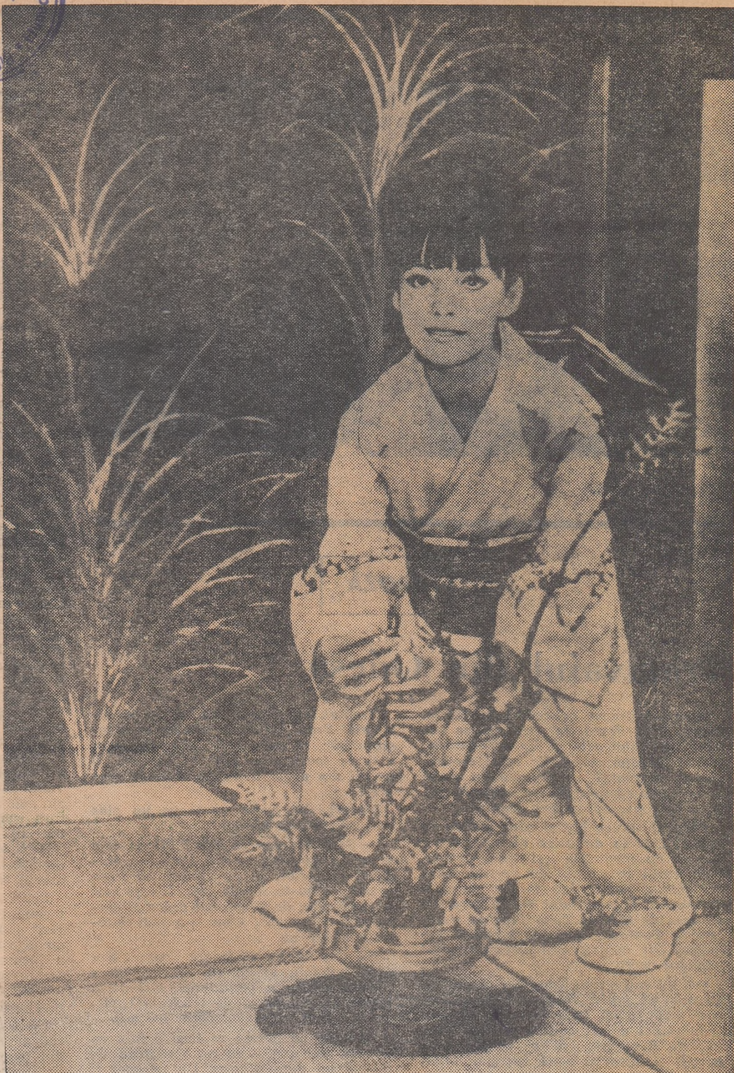
Dacă n-o cunoașteți pe japoneza din fotografie, v-o putem recomanda: e... Liudmila Savelieva (Natașa din „Război și pace”) care-i foarte populară acum la Tokio