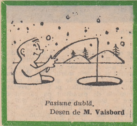
Pasiune dublă. Desen de M. Vaisbord