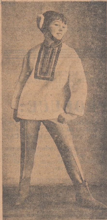
Casa unională de modă din Moscova a creat pentru odihna și sportul de iarnă acest costum practic și elegant, care folosește motive populare rusești.

Pentru îmbrăcămîntea sportivă e caracteristică linia laconică a croielii. Creatorii sovietici sînt preocupați de noi forme și proporții. Ei propun pentru