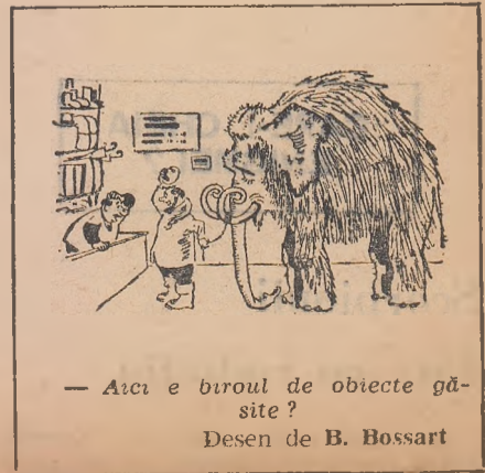
— Aici e biroul de obiecte găsite? Desen de B. Bossart