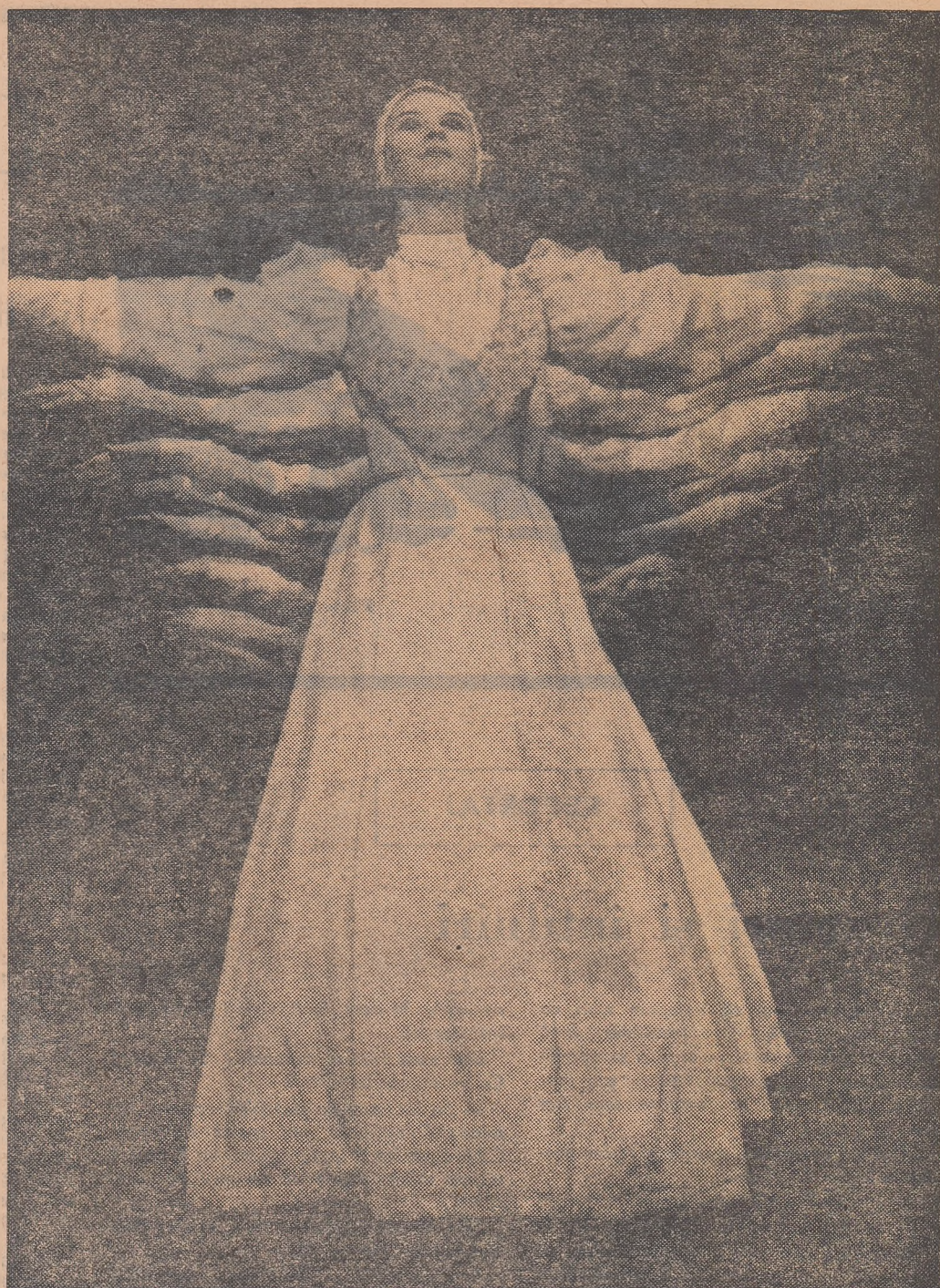
Zina cu douăzeci de brațe

Pietoni cu stegulețe și plantații fără pământ