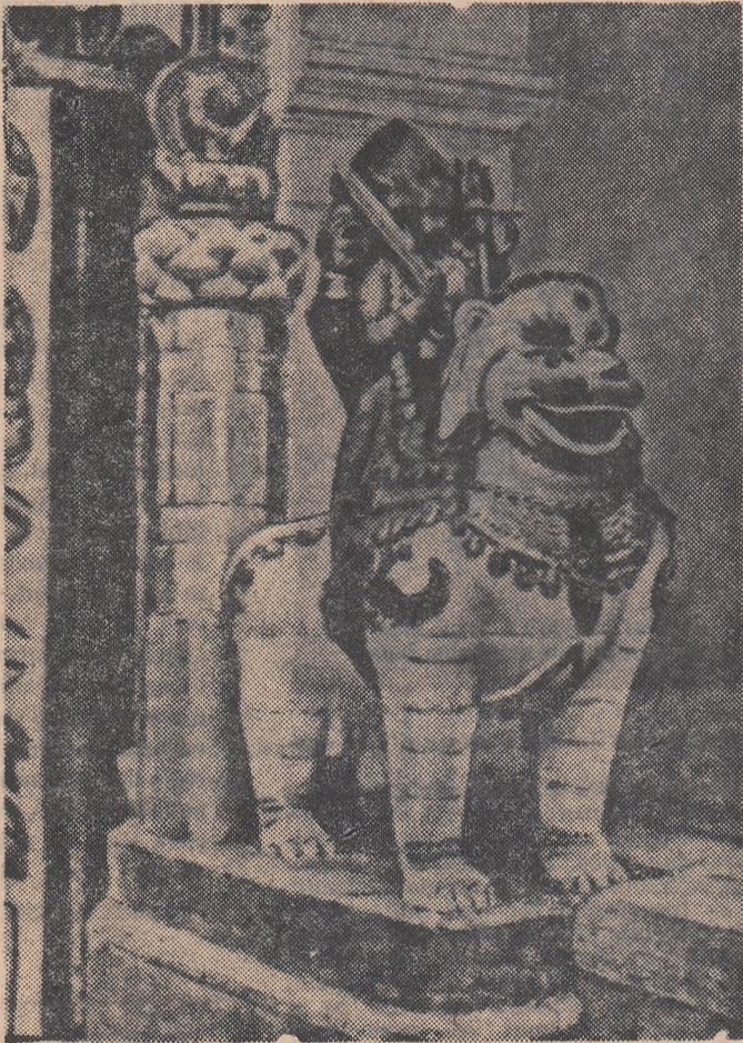
Casele nepalezilor sînt străjuite de lei feroși

Să începem, totuși, cu vechiul Katmandu, în care, la prima vedere, vremea nu s-a atins de ulicioarele înguste și unde veacurile au trecut nepăsătoare pe lângă căsuțele minuscule, lăsîndu-le neschimbate arhitectura și cornișele de lemn și pervazele sculptate. În piațetele din preajma numeroaselor temple continuă a se face și acum negoț cu cereale și cu celebrele hukri — cuțite încovoiate — vase de pămînt și stufe grosolane de lînă, țe-