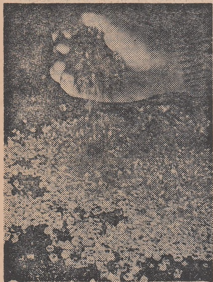
Diamante „anonime”. Celebritățile sint rare

De altfel, Iakutia a furnizat o mare parte din cele câteva zeci de mii de carate, cite însumează diamantele prezentate la expoziție. Raritățile, ca mărimile și valoare, sint expuse într-o vitrină specială: „Maria” (106 carate), „Valentina Tereshkova” (51 carate),