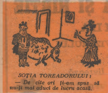
SOȚIA TOREADORULUI: — De cîte ori ți-am spus să nu-ți mai aduci de lucru acasă.

care s-a fisticit cînd s-a văzut față în față cu idolul publicului spaniol.