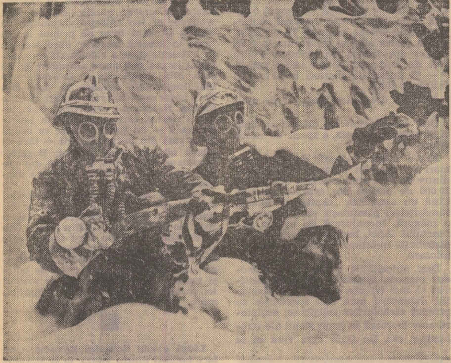
O iluzie creată de pompieri : zăpada din fotografie nu e decît spuma stingătoarelor de incendiu