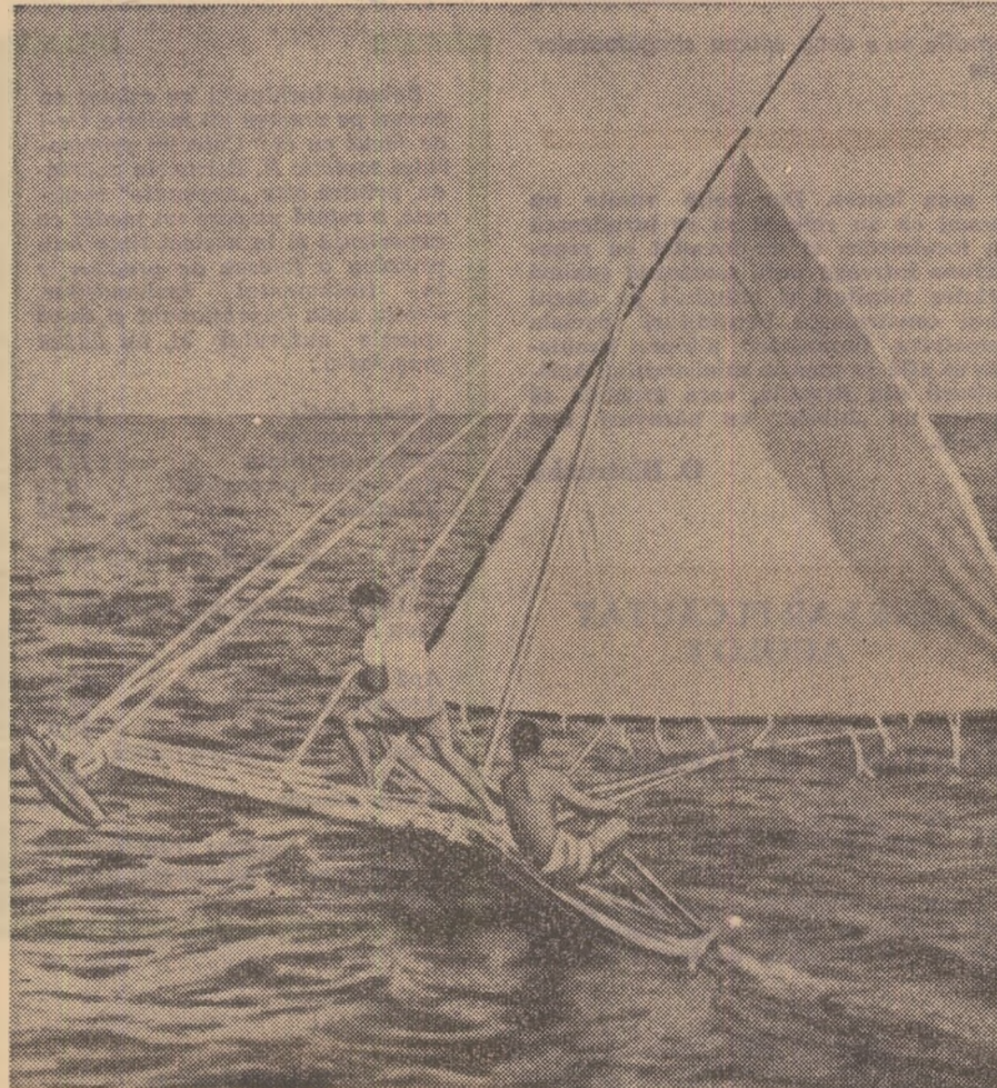
Manevrarea pirogii cere multă îndeminare

— Pescuiesc, adun scoici, mă duc în junglă cu prietenii și mă scald în mare. Insularii lucrează de plantatiile de