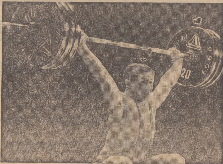
Cite kilograme va totaliza Viktor Kurenkov la Ciudad de Mexico ?

Neputînd rămîne indiferentă la ce se petrece în jur, redacția revistei „Sportul în U.R.S.S.” a fost și ea contaminată de această febră generală. Dar cum numele obligă, a lucrat pe o bază științifică, chemînd în ajutor mi-