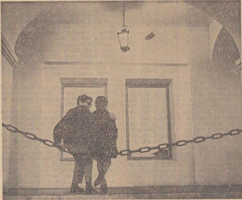
Dot pe un balansoar...

Dacă papirusului Ebers i se pot reproșa frecvențele imbinări dintre medicină și magie un alt text ajuns pînă la noi, așa-numitul papirus Edwin Smith, poate fi considerat, în schimb, un adevărat tratat de chirurgie în care sînt descrise 48 de traumatisme diferite și metodele de tratare a lor. Din acest document aflăm că medicii din Egiptul antic se încumetau să facă operații complicate și aveau instrumente din bronz — bisturie, ace etc. — șlefuite cu grijă. După cum rezultă din papirusul lui Smith, ei începeau prin a stabili întocmai ca azi, simptomele subiective, interogînd bolnavul. Apoi procedau la examinarea propriu-zisă a pacientului, după care, respectînd canoanele medicale ale timpului, comunicau bolnavului una din următoarele trei variante: 1) Voi trata