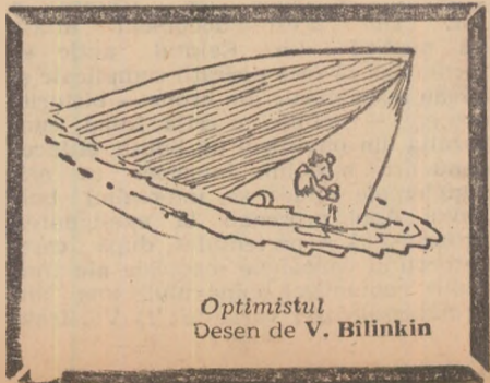
Optimistul Desen de V. Bilinkin