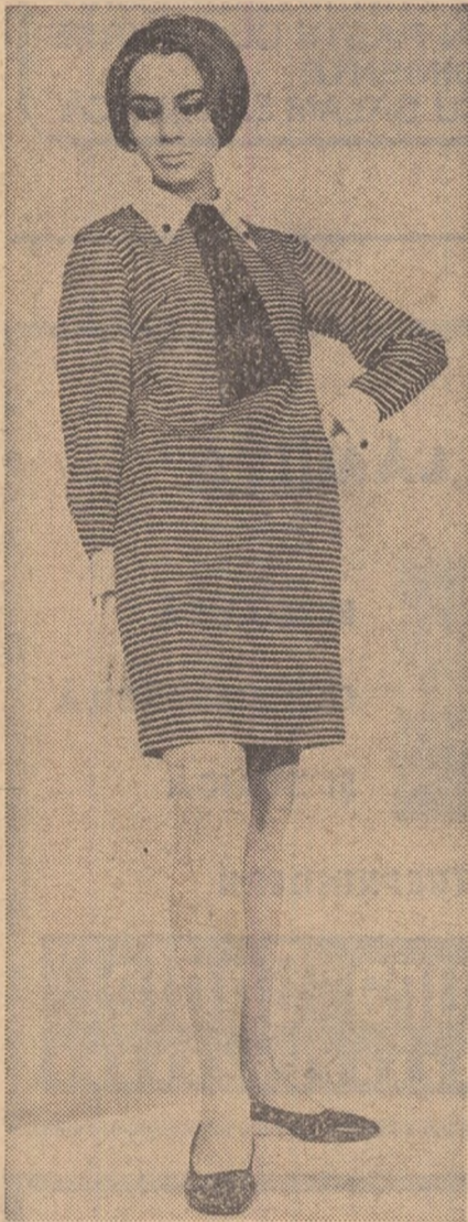
In plină domnie a stilului sport (model creat la Harkov)

Demonstrația lor a fost un real succes, subliniat nu numai de aplauze, de prezența masivă a publicului și de ecurile elogiase din presă („Moda rusă a cucerit Londra”, „Modelele rusești fac săli pline”, „Ne-a plăcut „Ivuška și „Viatka”); în afară de ace-