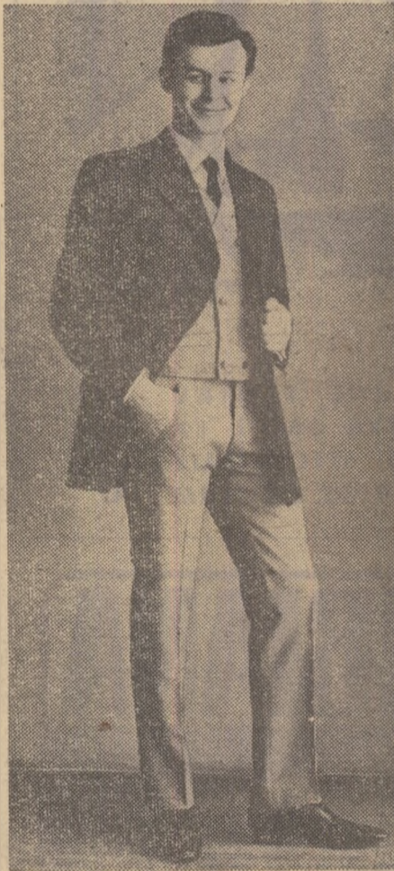
Costum cu vesfon de velur, creat de Casa de mode din Moscova

Dacă am face o istorie a catifelei în îmbrăcămintea masculină ar trebui să suim mult în urmă în timp. Dar în ciuda acestor venerabile state de serviciu, tipul de țesătură de care ne ocu-