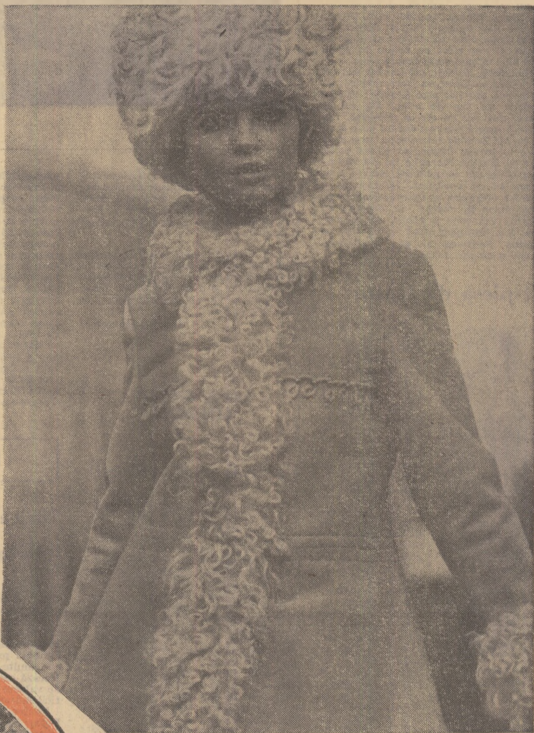
Gata pentru iarnă !...

Asaltul invizibilului ● La sugestia lui Fantomas ● Elefanții contra locomotivelor ● O notă în or- chestra naturii ● Nu vă infuriați! ● Aspirina ne poate impăca cu dentistul ● Memoria pe care o dorim ● Alimentația și sănătatea