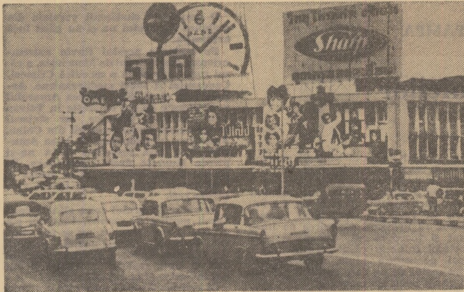
Stradă centrală din Bangkok

Fostă capitală a Tailandei, orașul Chiang Mai se află într-o vale în formă de cupă — odinioară un lac imens — încinsă de lanțuri muntoase scunde. Acum, Chiang Mai are circa 80 000 de locuitori și e al doilea oraș ca mărime din Tailanda. O veche cronică menționează că, la un moment dat, regele