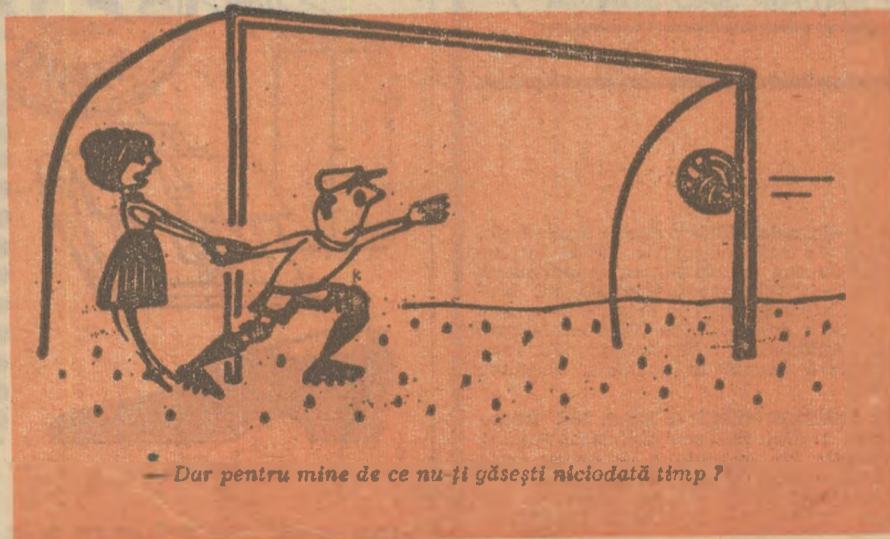
— Dar pentru mine de ce nu-ți găsești niciodată timp? —

După război a lucrat la Institutul central de cercetări științifice în domeniul culturii fizice din Moscova și a publicat pînă acum peste șaptezeci de lucrări. Acest „doctor în fotbal”, cum