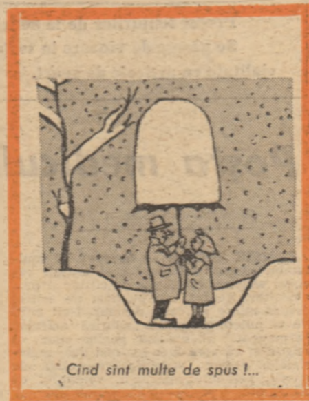
Cînd sînt multe de spus !...