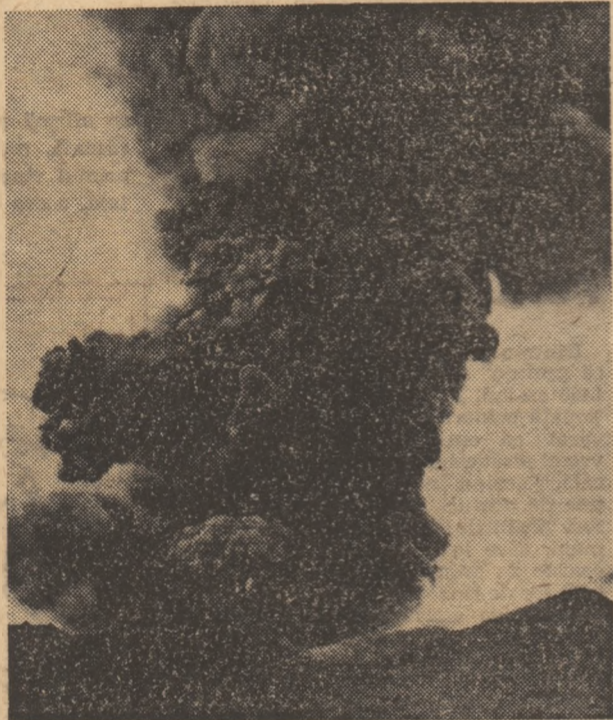
„Mesaj” din centrul Pământului

În dimineața zilei de 20 mai 1883, Krakatau s-a trezit însă din lunga-i somnolență cu clocoțite și bubuituri, care se propagau pe o rază de 500 de kilometri. Din conul vulcanului Perbuwatan s-a ridicat spre tări o coloană de vapori fierbinți de peste 10 000 de metri înălțime. Apoi, intensitatea erupției a început treptat să scadă. Se părea că furibundul crater al vulcanului încetase să mai clocotească, că monstrul adormise din nou pentru câteva secole. Dar pătrunzând în giganticul rezervor în care plutea magma, apa a format o cantitate uriașă de vapori. Magma clocotitoare s-a ridicat pe canalul