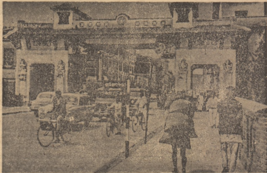
O stradă din Katmandu

După ce străpunge picla dimineții care învăluie orașul, soarele își începe opera de vrăjitor. Mai întii smulge din aburul lăptos turnurile înalte din Katmandu — capitala Nepalului, casele de locuit și palatele, Raze piezișe pătrund ca o lamă de pumnal, pe cele mai înguste străduțe ale orașului vechi și sint reflectate de acoperișurile aurite