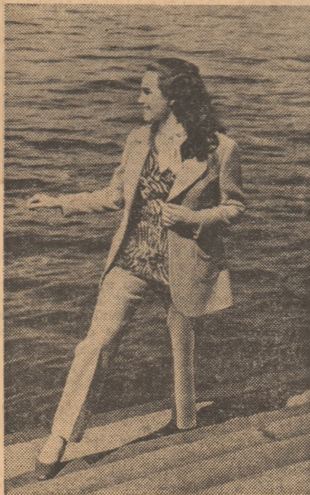
O vizitatoare insolită pentru acest sezon.

de la Hosta care au pînă la 400 de grame acid sulfhidric la litru. Evantaiul maladiilor tratate cu aceste medicamente rare merge de la bolile sistemului nervos, cele cardiovasculare, de piele, pînă la afecțiunile ginecologice.