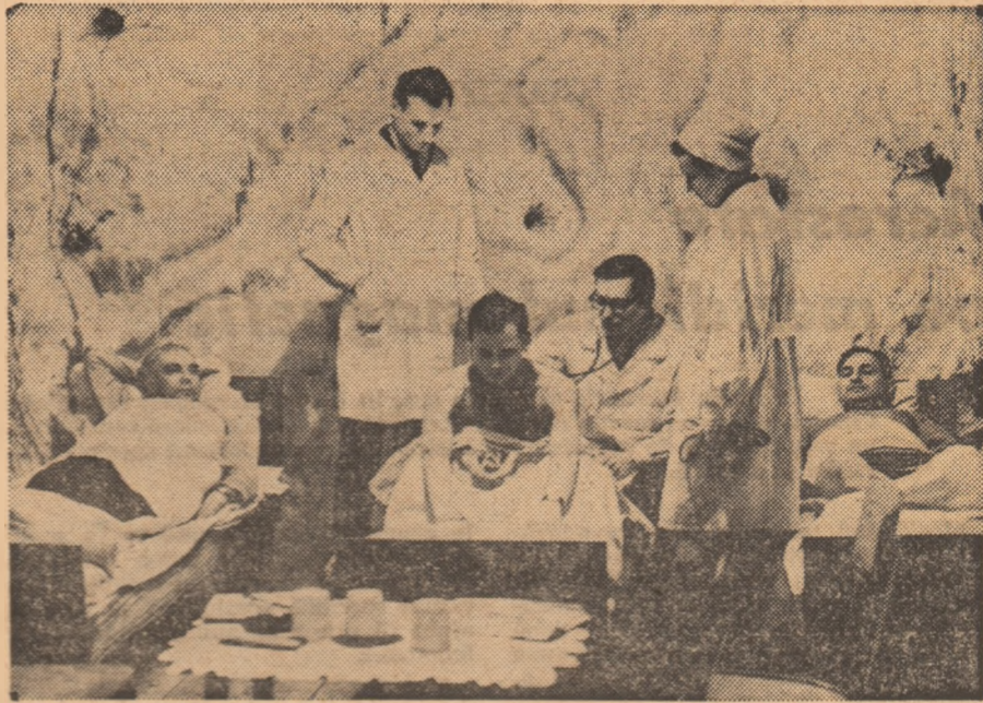
Intr-o mină de sare, la o adîncime de 206 metri, a fost înființată în U.R.S.S. prima clinică de alergologie pentru tratamentul astmului bronșic.