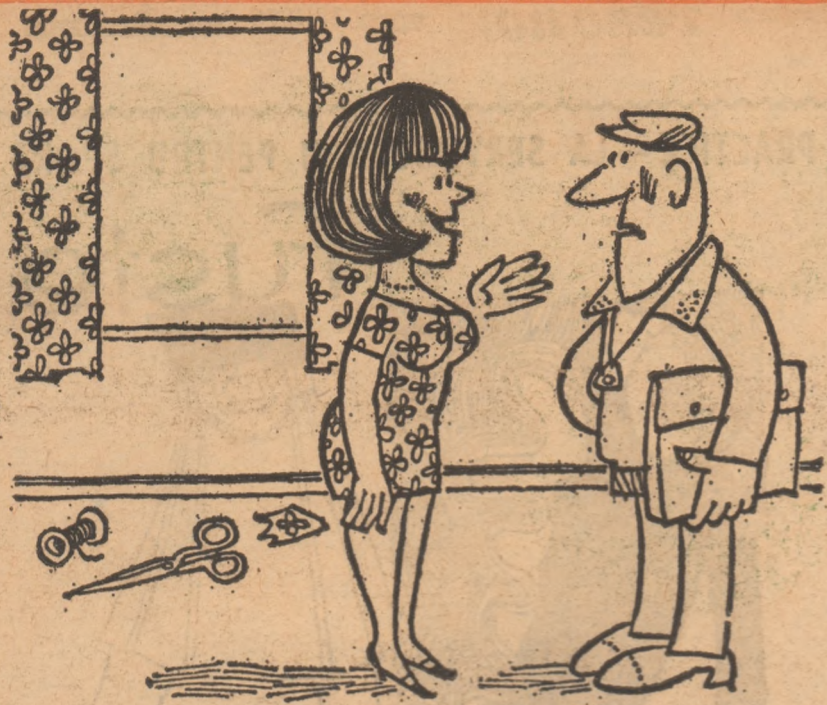
— De ce ești așa mirat? N-ai mai auzit pînă acum despre economia de materiale?

— M-da... a oftat directorul. În fine, mă descurc eu într-un fel, am să mă uit ce cumpără alții.