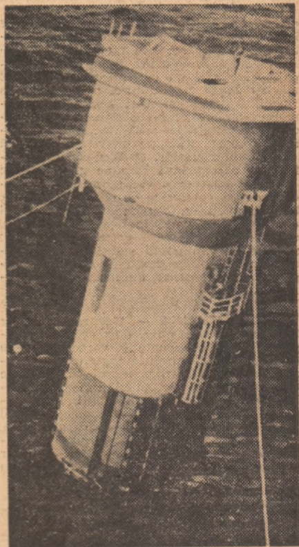
Una dintre soluții: platforma cilindru, practic imobilă.

Atunci cînd specialiștii și-au pus problema platformelor semi-submersibile ei au abordat-o cu rigoarea fizicii fundamentale. Cîte picioare să aibă ele, trei, patru...? În ambele cazuri trebuia prevăzută o orientare în lupta împotriva hulei puternice. După multe studii, hidrodinamicienii și-au dat seama că un pentagon ar avea însușiri deosebite, puțînd înfrunta hula din toate direcțiile, în timp ce un hexagon sau heptagon ar fi sediul rezonanțelor la eforturile ritmate venînd sub anumite unghiuri. Platformele semi-submersibile sînt flotante și deci potrivite pentru marile adîncimi; picioarele lor sînt „încălțate” cu uriașe flotoare care se afundă suficient pentru a nu oscila la asaltul valurilor. Specialiștii cred în viitorul acestei formule combinate, însă, cu „ancorarea dinamică”. Platforma ar urma să fie traversată de doi abori verticali cu elice orientabile la capete, poziția necesară fiind păstrată de un cablu de oțel ce ar porni de la fund și ar trece printr-un puț central. Înclinația cablului și viteza cu care ea s-ar modifica ar fi transmise la un calculator electronic care ar determina orientarea ce tre-