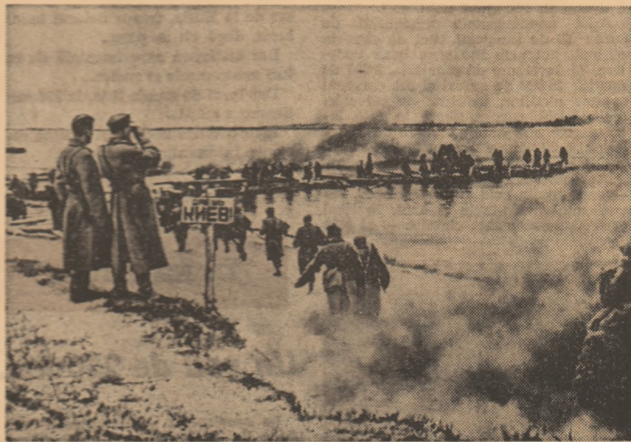
Armatele sovietice înaintau spre Kiev...

La 13 februarie Pastuhov a cumpărat o fișică locală scoasă de ocupanți în limba ucraineană și a citit bucuos o știre publicată cu întîrziere: „La 9 februarie 1944, vice-governatorul doctor Otto Bauer, șeful guvernului din