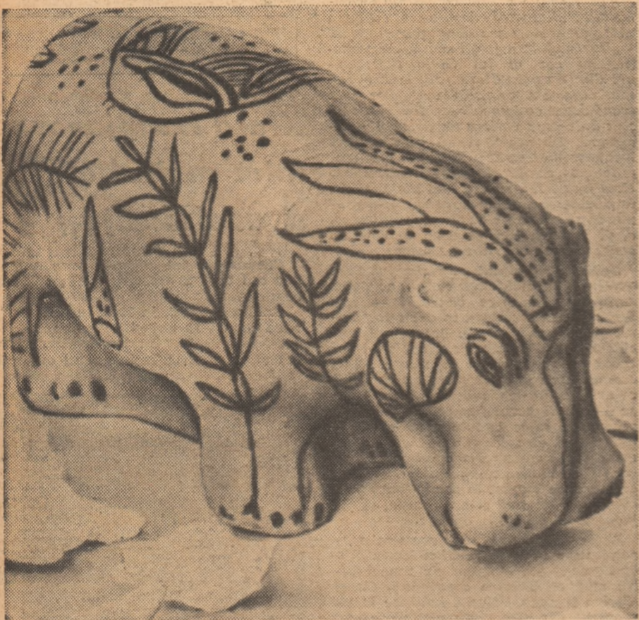
Statueta proaspăt ieșită din învelișul în care a fost arsă

Materialul obiectelor sacrificate s-a dovedit a fi foarte friabil, fărâmițându-se chiar cu mîna după îndepărtarea pojghiței pseudo-smălțuite care este foarte dură și constituie un înveliș protector. O analiză sumară a arătat că e vorba de silice sau oxid de siliciu. Dar silicea se găsește în natură sub mai