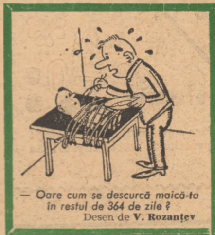
— Oare cum se descurcă maică-ta în restul de 364 de zile? Desen de V. Rozanțev