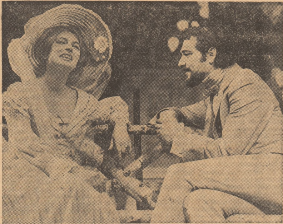
Natalia Petrovna și Rakitin într-un moment de bună dispoziție