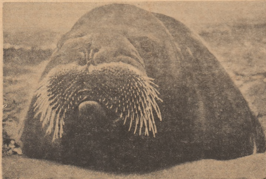
Un scufundător, dar nu cu cele mai bune rezultate

În sfîrșit, experiențe făcute cu cîteva animale de uscat au arătat că șobolanul, de pildă, poate rămîne sub apă 3 minute și șase secunde, iar ciinele 4 minute și 25 de secunde. Este destul de mult, dar să ținem seama că animalele de experiență nu fac sub apă nici un efort, în timp ce foca Wedell, de pildă, poate parcurge în timpul scufundării sub gheață pînă la patru kilometri.