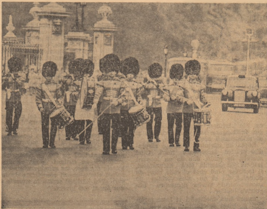
Zilnic, la ora 11.30, în fața palatului Buckingham are loc, în acordurile solemne ale fanfarei, schimbarea gîrzii

Din toate părțile au început deci să curgă întrebări: ce s-a întimplat cu