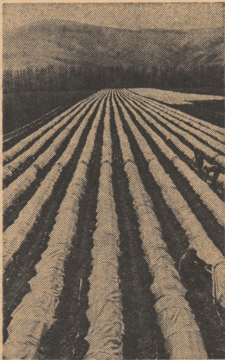
Serele unui sovhoz din R.S.S. Kazahă

De altfel, și în alte regiuni din Federația Rusă, Azerbaidjan, Kazahstan,