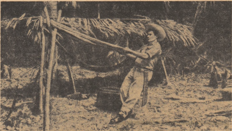
Un mijloc rudimentar de încercare a calității gumei indiene

Sucul de chikle e recoltat în genere de oameni foarte necăjiți, dezmoșteniți ai soartei. În Guatemala, cel mai mulți culegători sînt foști țărani care au trebuit să-și părăsească minusculele lor loturi de pămînt, din pricină că nu-și puteau plăti datoriile care creșteau an de an, insuportabil coșmar al vieții lor amare. În provincia mexicană Quintana-Roo prețiosul suc este extras de niște urmași ai toltecilor care se află încă în stadiul comunei primitive. Acum 80 de ani ei s-au răsculat și au fugit în junglă. Astăzi, nu-și mai amintește nimeni de ei. Pînă și inspectorii financiari ridică nedumeriți din umeri cînd sînt întrebați din ce trăiesc locuitorii junglei. În nordul Yukatanului, culegătorii sînt alcătuiți aproape în întregime din delicvenți fu-