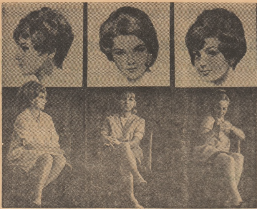
Creatoarele și opera