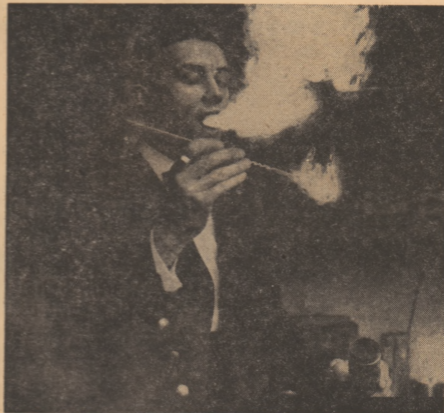
Un truc care se soldează adesea cu o gravă imbolnăvire a scamatorului

Scamatorii din India și-au dobîndit de mult o faimă binemeritată, dar Egiptul a dat totuși o „pleiadă“ de magicieni mai pricepuți decît confrății lor indieni. Egiptul este de altfel patria magiei. Încă din secolul al XIV-lea arabil Ibn-Batuta a descris o scamatorie cu o fringhie în jurul căreia a țesut și o legendă pe care mai apoi a răspîndit-o în toată lumea. Se spune chiar că