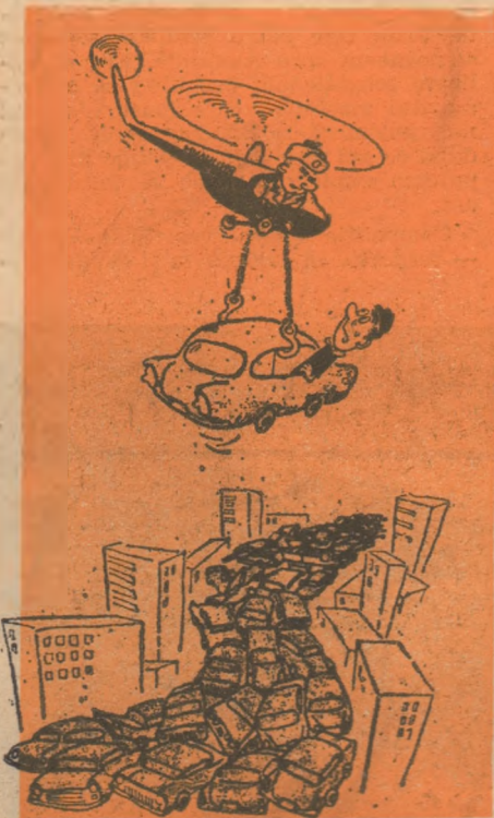
— Dar n-am comis nici o infracțiune!!!

„Ka-26” servește ca aparat de școală cu comenzi duble pentru antrenarea piloților de elicopter, dar și de avion. Dacă intră în serviciul sanitar, cabina este prevăzută cu toate cele necesare pentru tratamentul de urgență al accidentaților. Medicul poate efectua trans-