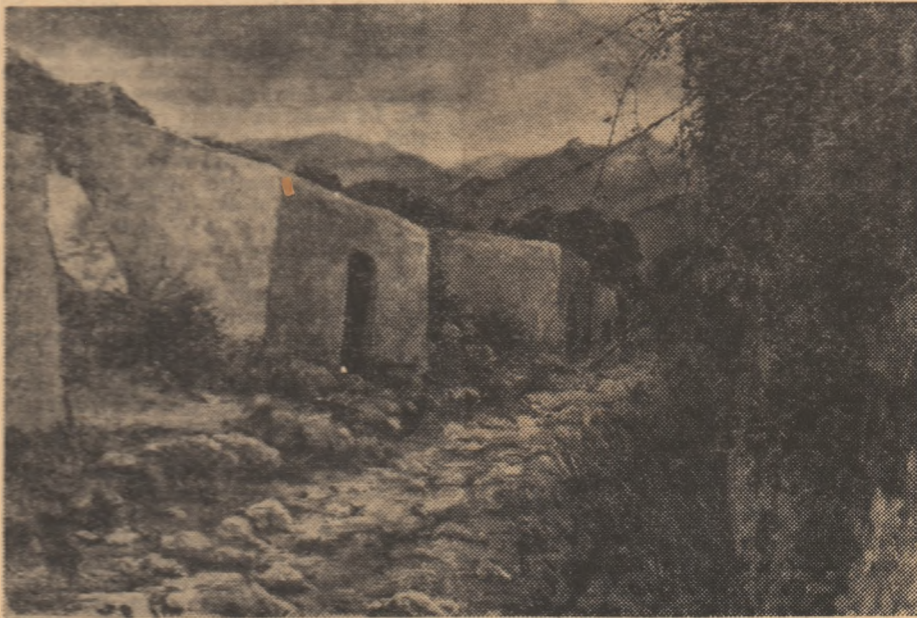
O „mostră” din traseul raliului etiopian.

N-am s-o iau de la începutul începutului, ci am să amintesc numai că după ce am străbătut 10 000 de kilometri, extrem de dificili, prin unsprezece țări am ajuns la Bombay. După o oră urma