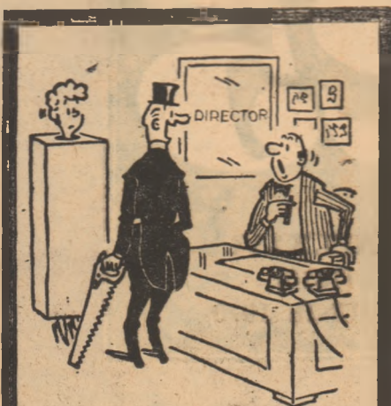
— Noutatea numărului meu constă în faptul că eu o tai cu adevărat.