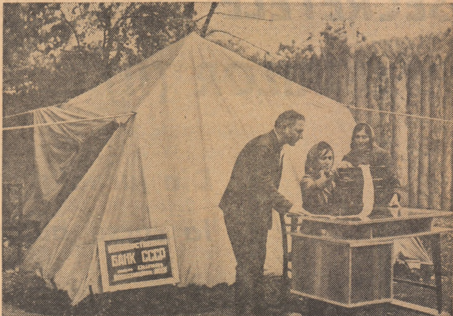
După cutremurul din Daghestan, nu numai locuințele, ci și instituțiile publice au trebuit să fie mutate în corturi. În fotografia noastră: Filiala Băncii de Stat din satul Dilim