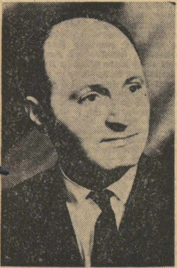
Prof. univ. dr. Solomon MARCUS

Este posibil ca o mașină să înțeleagă un mesaj de limbă și să-l prelucereze din diferite puncte de vedere? Astăzi se știe că răspunsul la această întrebare este afirmativ, dar condiționat de programul pe care omul îl introduce în mașină. Realizarea acestui program se va baza, evident, nu pe semnificațiile cuvintelor care alcătuiesc mesajul, ci pe raporturile formale pe care acestea le contractează, deoarece acestea din urmă sînt singurele care permit o descriere cu gradul de precizie pe care-l cere mașina. Tocmai în realizarea acestui program își găsesc aplicarea descrierile promovate de lingvistica structurală și matematică. Pe de altă parte, analiza lingvistică destinată mașinii, modul în care mașina înțelege această analiză orientează dezvoltarea analizei structurale și matematică a limbii, stimulînd-o pe calea care corespunde cel mai bine dezideratului formalizării. Se constată că cel mai practic criteriu al caracterului formal al unei descrieri lingvistice este posibilitatea ca o mașină să înțeleagă această descriere. Tocmai aici se află motivarea faptului că lingvistica matematică s-a constituit numai după apariția calculatoarelor electronice și dezvoltarea ciberneticii.