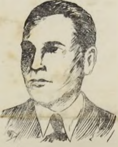
Tov. GHEORGHE APOSTOL

M. a scos în relief poziția sindicatelor în actualul regim, spunând între altele: