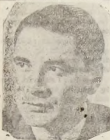
1. GHEORGHE APOSTOL (P. C. R.)

care asigură drepturile și libertățile cetățenești în România Democrată.