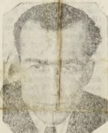
4. ALEXANDRU DRĂGHICI (P. C. R.)