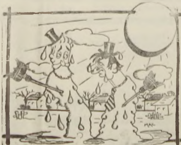
Se topesc văzând cu ochii.

Una din caracteristicile listelor „istorice”, este asemănarea în fapte și nelegiuri a candidaților.