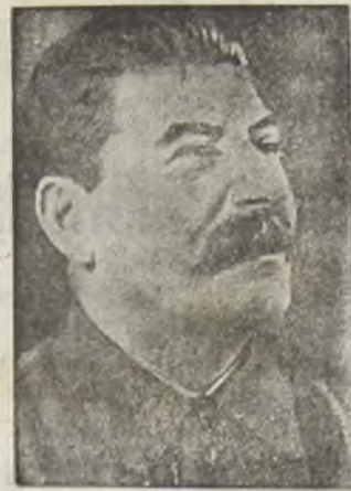
Generalissimo I. V. Stalin

MOSCOVA. — Ziarul „Steaua Roșie”, oficiul armatei, a anunțat că Iosif Visarionovici Stalin, a fost ales în unanimitate în Sovietul Suprem, în districtul electoral „Stalin” din Moscova, unde și-a fost prezentată candidatura.