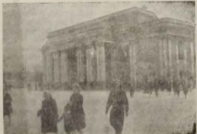
Un aspect al orașului Voronej (U. R. S. S.)