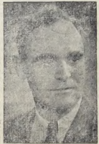
Tov. Gheorghe Gheorghiu-Dej

În ziua de 8 Mai 1921 s'a deschis istoricul congres al Partidului Socialist Român care a hotărât transformarea vechilui Partid Socialist într'un Partid Comunist. Hotărârea aceasta, expresie a voinței a peste 90% din membrii Partidului, a avut drept consecință arestarea tuturor membrilor congresului care o votaseră și înșenarea unuia din cele mai monstruoase procese din câte a cunoscut istoria luptelor pentru democrație și pentru libertatea poporului român. Congresul din Mai 1921 a luat hotărârea cea mai potrivită cu situațiunea politică și cu interesele clasei muncitoare. Crearea Partidului Comunist Român corespundea pe deplin atât situației