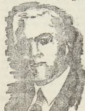
DI. DR. PETRU GROZA

nind dela acest adevăr, declarăm numele guvernului nostru următoarele: