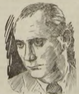
Tov. TEOHARI GEORGESCU

Trăiască în veci prietenia între România și Uniunea Sovietică.