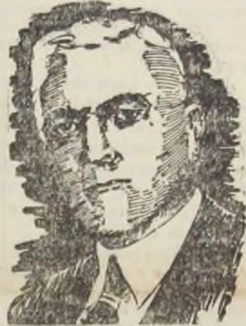
Dr. PETRU GROZA

Ele au fost posibile și datorita colaborării dintre partidele care formează Blocul Democratic și factorul constituțional colaborare care a mers până la decorarea de către M. S. Regele a d-lui Dr. Petru Groza, pentru înlăturarea guvernului de sub președinția d-sale, în ciuda manevrelor clicei reacționare care a încercat să zdruncine această înțelegere.