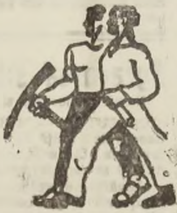
Administrația Financiară Hunedoara.