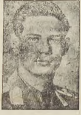
M. S. REGELE MIHAI I

la orașe și sate, cari au răspuns cu însuflețire la chemarea guvernului lor democratic și care iau azi parte activă la conducerea țării