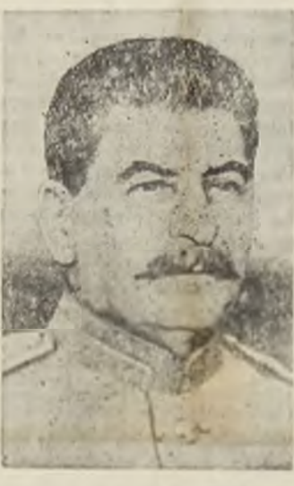
Generalissimo I. V. STALIN