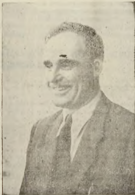
Tov. GH. GHEORGHIU-DEJ

Nu mai o clică de reacționari, moșieri expropriați unelte antonesciene epu ate și foști legionari notorii străși în jurul lui Maniu și Brătianu nu se pot împăca cu realitățile politice și sociale din țara noastră deoarece ei urmăresc interese înguste de clan urmăresc exploatarea țărănimii de către moșieri, desfășoară o politică antinațională apelând la sprijinul cercurilor reacționare de peste hotare, încearcă printr'o agitație