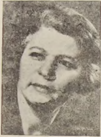
Tov. ANA PAUKER

23 August 1944, a însemnat pentru noi, înfrângerea oștilor naziste, care se aflau în țara noastră răsturnarea d'ctaturii lui Antonescu, prin actul plin de curaj și energie a poporului Român