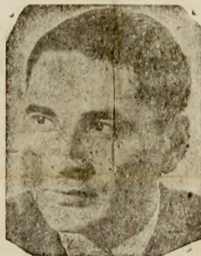
TOV. GHEORGHE APOSTOL

Acestea sunt: realizarea și depășirea programului de producție, justa repartitie a bra-