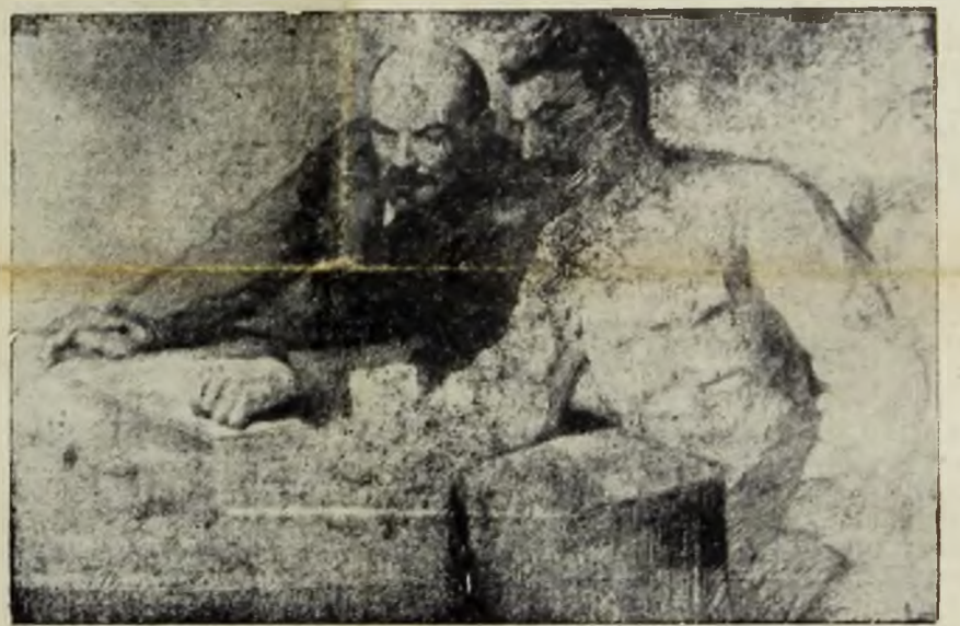
Lenin și Stalin genialii organizatori și conducători ai Mării Revoluții Socialiste din Octombrie