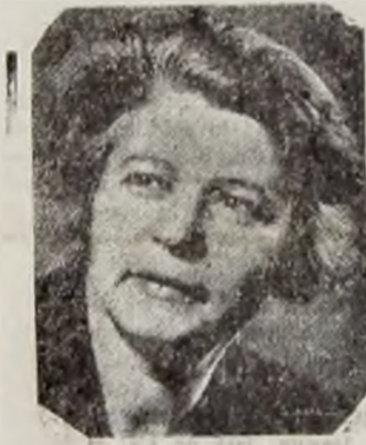
Tov. Ana Pauker

Am văzut din raportul politic general făcut de tov. Gh. Gheorghiu-Dej cât de diverse sunt problemele care ne stau în față. Casa noastră în care înainte eram ținuți prin violența ca slugi ale clasei stăpânitoare, devine cu adevărat o casă a poporului. Lucrând liber, lucrând pentru noi, vom face ca țara noastră să fie o țară a buniei stări și bucurii, vom garanta pentru totdeauna dreptul nostru de a o stăpâni în libertate și pace.