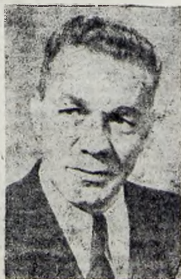
Tov. Emil Bodnăraș

Ordinul general către armată semnat de către tov. EMIL BODNĂRAȘ, ministrul Apărării Naționale