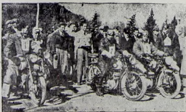
Prima serie a participanților la cursa de motocicletă Deva C. G. M. în start