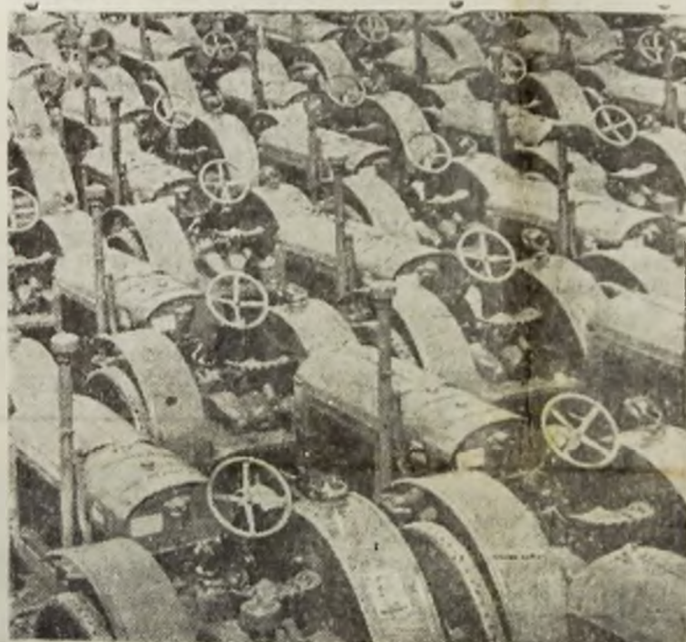
Tractoare gata pentru a fi trimise centrului de mașini