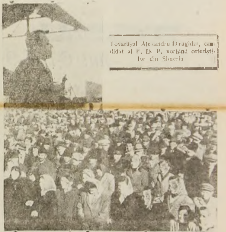
Tovarașul Alexandru Drăghici, candidat al F. D. P., vorbind ceteriștii-ilor din Simeria