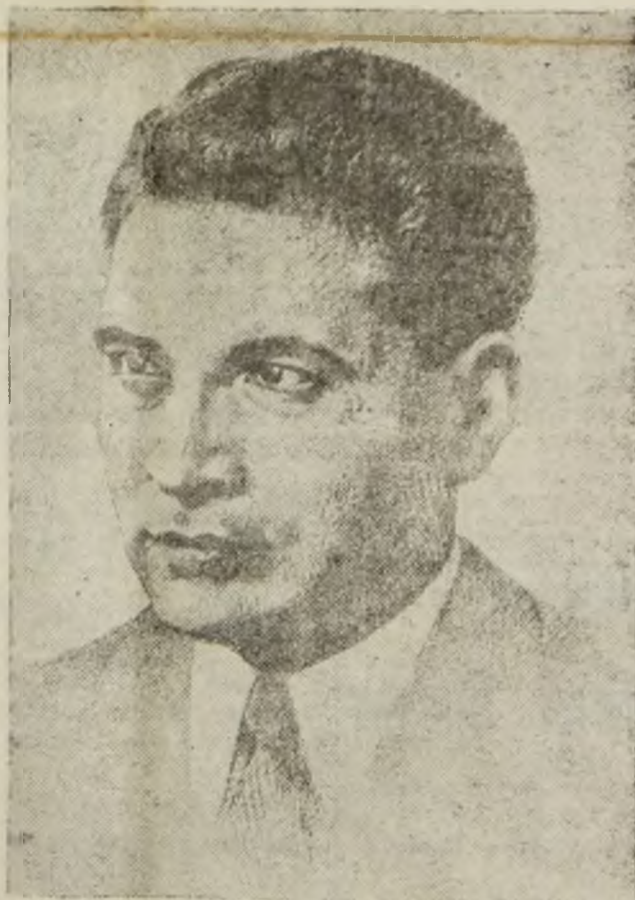
Tov Gheorghe Apostol

dragostea de muncă, de meserie. În toamna lui 1927, intra în școala de meserie C.F.R. din Galați. În 1931, iese turnător, devenind și membru al Sindicatului C. F. R. din Galați. O viață nouă începe atunci pentru Gh. Apostol. O viață grea, de luptă pentru pâine, pentru libertate. Lupta de care nu s'a despărțit niciodată, ci în fruntea căreia a stat întotdeauna stăruind-se între conducători ei.