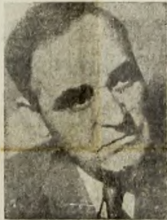
Tov. Gh. Gheorghiu-Dej Președintele Comisiei Ministeriale pentru Redresarea Economică și Stabilizarea Monetară.

În ziua de 30 și 31 Martie misiunii Ministeriale pentru Redresarea Economică și Stabilizarea Monetară sub președinția tov. ministru ceta proiectul de buget al Statului care le trebuesc aduce legislației fiscale pentru realizarea noului buget.