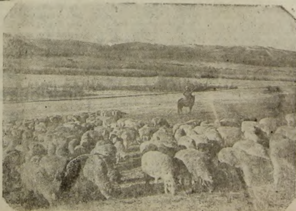
O turma de oi de rasă a colhozului „Lenin” din regiunea Cita, Siberia Răsaritoare.