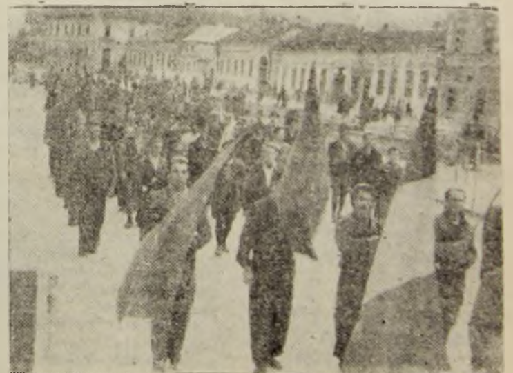
Brigada defilând prin centrul orașului în drum spre gară.