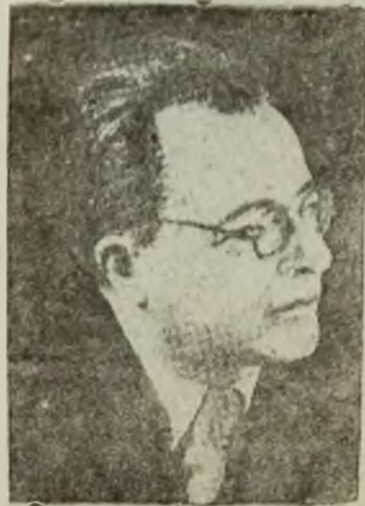
PALMIRO TOGLIATTI secretarul general al Partidului Comunist Italian