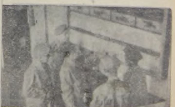
„Înaintea de a intra la muncă” consfătuiri importante ține în întrecerilor socialiste