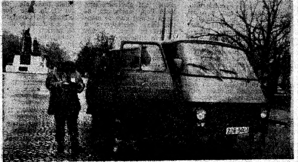
În apropierea Televiziunii Române Libere, tineri și tinere din municipiul Petroșani au sprijinit acțiunile de control asupra mijloacelor de transport.