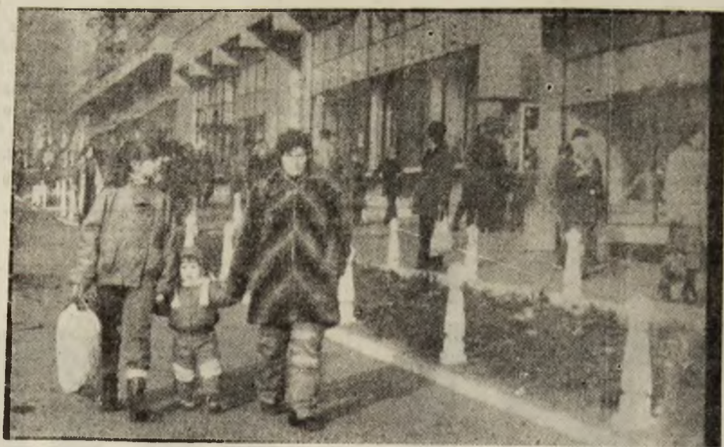
Din cînd în cînd, puțin soare pe străzile Petroșaniului.

N.R. Precum ați observat, stimată cititoare, referitor la situația de la Sala sporturilor și alte abuzuri petrecute, noi am scris obiectiv, am luat atitudine. Cît privește, numele, nu înțelegem de ce nu l-ați scris cinstit, deschis. Nu mai aveți de cine vă teme, nu mai aveți de ce să vă ascundeți. Să spunem cu curaj, deschis, democratic, lucrurilor pe nume. (II. ALEXANDRESCU)