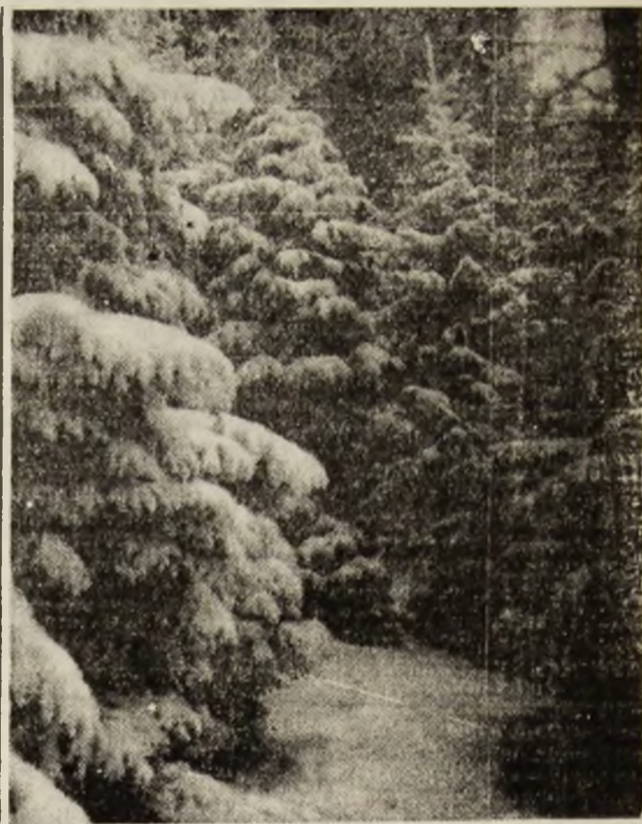
Liniște în Paring.