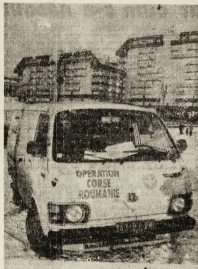
Prieteni din Corsica — la Petroșani.

• Lucrătorii de la Stația de Utilaje pentru Construcții și Transport Petroșani au depus în Contul „Libertatea — 1989“ suma de 445 000 lei, reprezentînd fondul de premerere de 2 la sută. (II. ALEXANDRESCU)