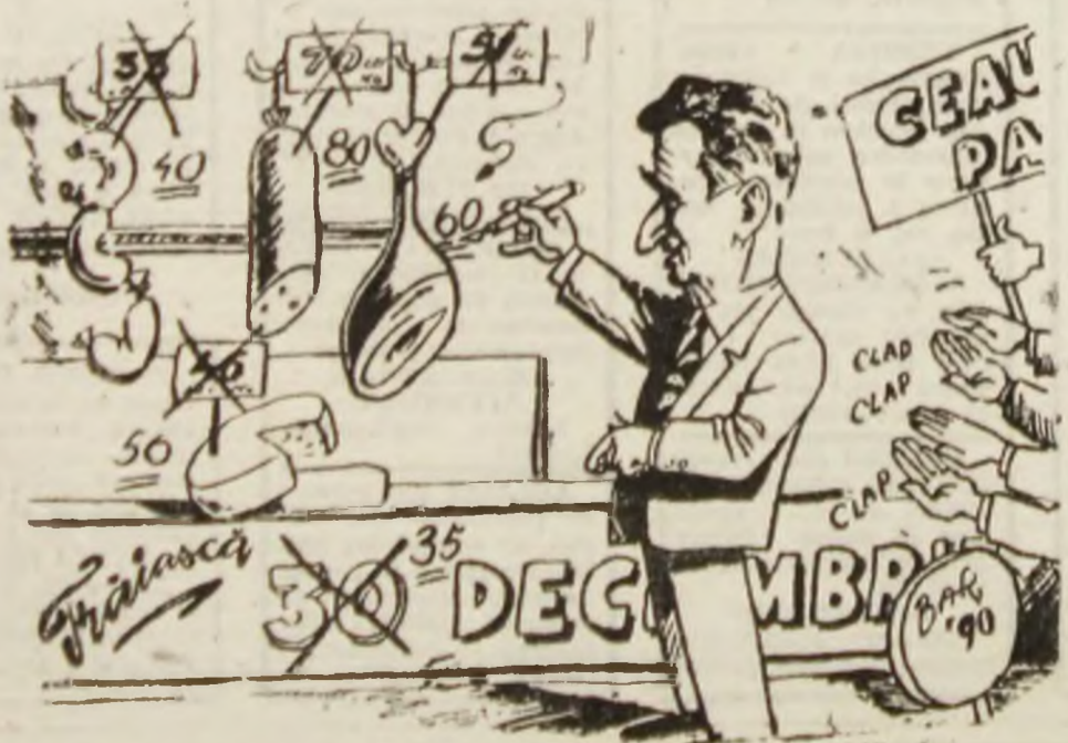
„S-a asigurat îmbunătățirea calității produselor...“