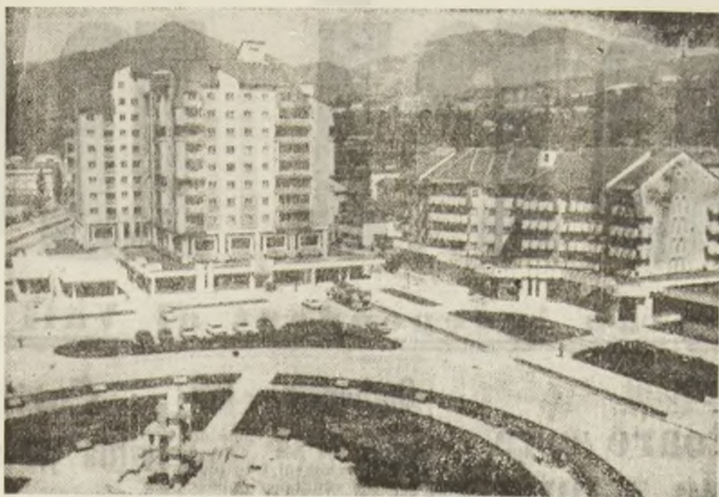
Piața Victoriei — Petroșani.