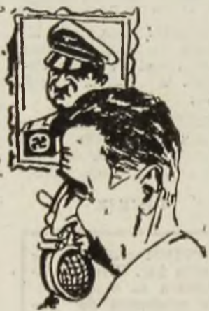
— Așa de Hitler ne dă să mîncăm numia cu sececa și ciocanu.

— Alo, drajii mei copii nestate dor de voi, să veniți cît mai repede și să ne aduceți niște tacămuri că porcul