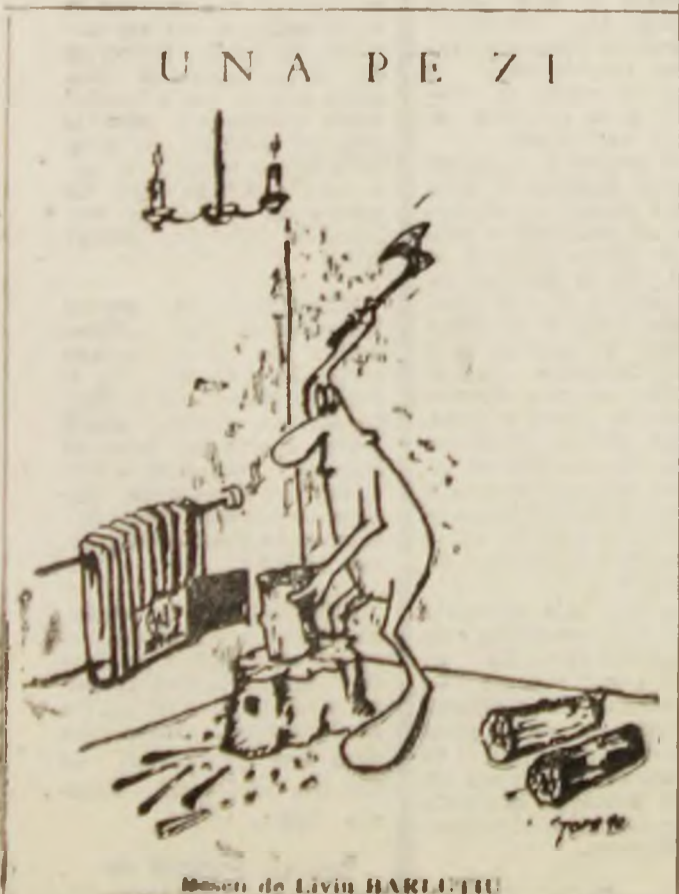
Desen de Liviu BARLETTU

Comunicatul este semnat de reprezentanții tuturor partidelor politice prezente la dialog și s-a citit în plenul sesiunii la încheierea ei, în limba franceză, pentru toți corespondenții presei străine și române.