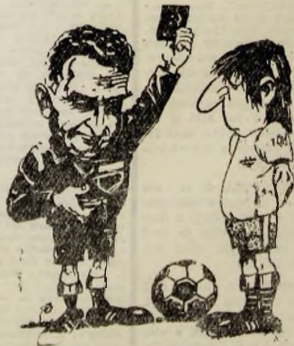
„Stimați spectatori... în minutul 16 lui GICA i s-a RIDICAT cartonașul roșu... Desen de Liviu BARLUȚIU