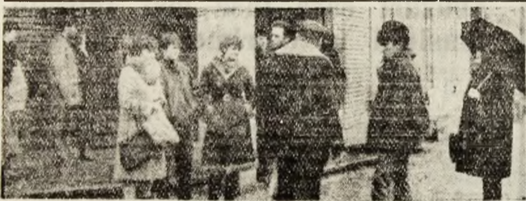
UN ȘOFER GRĂBIT...