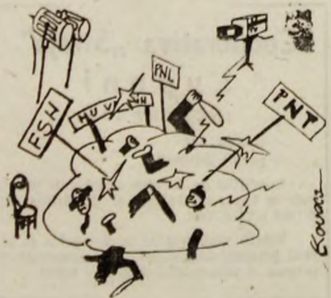
O mică dezbatere la masa rotundă între cele 3 partide. Desen de Ștefan KOVACS